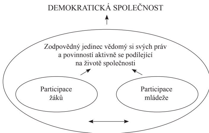
Obrázek 1: Model participace žáků a mládeže 4

Dnes existuje celá řada nejrůznějších více či méně širokých definic participace žáků. Český pedagogický slovník kolektivu autorů Průchy, Mareše a Walterové (2001) definuje participaci žáků jako charakteristiku „vyjadřující aktivní účast žáků v procesu výuky. V některých zemích se žáci zúčastňují rozhodování o cílech a obsahu vzdělávání a pravidlech života školy. Různými výzkumy je prokázáno, že