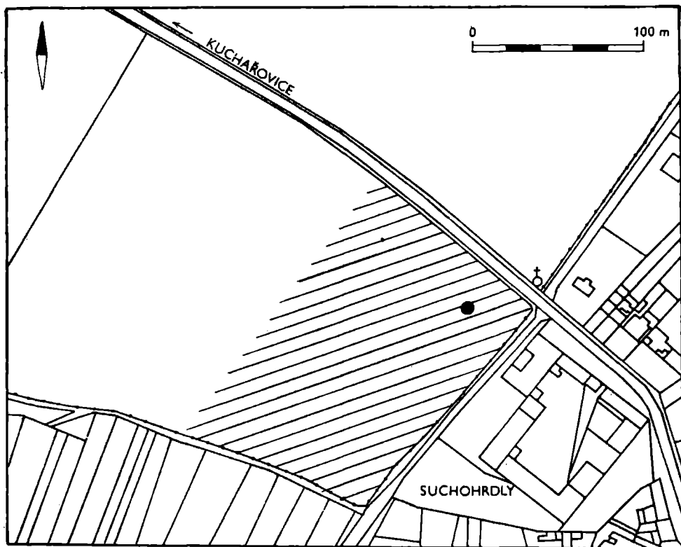
Obr. 1. Kuchařovice, okr. Znojmo. Místo výzkumu v poloze „Dolní Kasperek“. (Kresba: M. Bálek)

Při rozrušení jámy radlicí pluhu došlo také k promíšení materiálu, takže v prvních dvou vrstvách byly kromě předmětů MMK také střepy LK, středověké střepy, novověké střepy a recentní předměty z povrchu. Ve spodní části jámy (zachyceno „in situ“) pak byly střepy MMK a LK. Podle utváření spodní části a dna se jednalo o mísovité zahloubenou jámu o průměru asi 1 m.