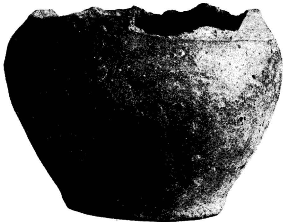
Obr. 6. Brno-Komín, popelnice. (1 : 3.)

Inventář neúplně zachráněného žárového hrobu z Brna-Komína sestává tedy nyní z těchto předmětů: