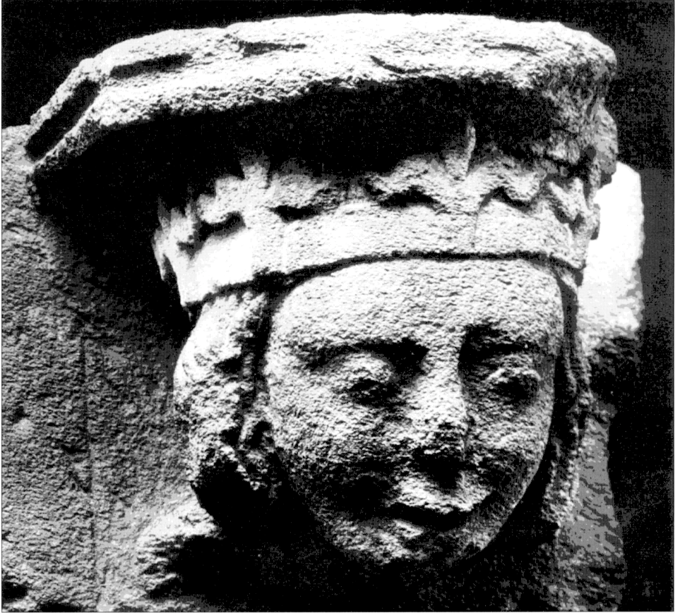
2. Konzola s hlavou královny z Olomouce. Olomouc, lapidárium. Bracket with the head of the Queen. Olomouc, Lapidarium.