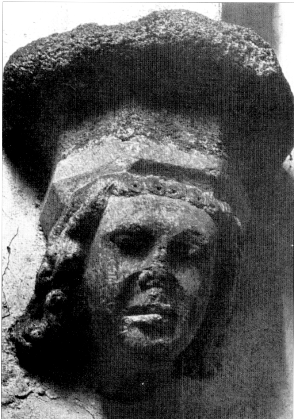
4. Konzola ze sakristie hradní kaple na Zvíkově. Bracket from the castle chapel of Zvíkov.