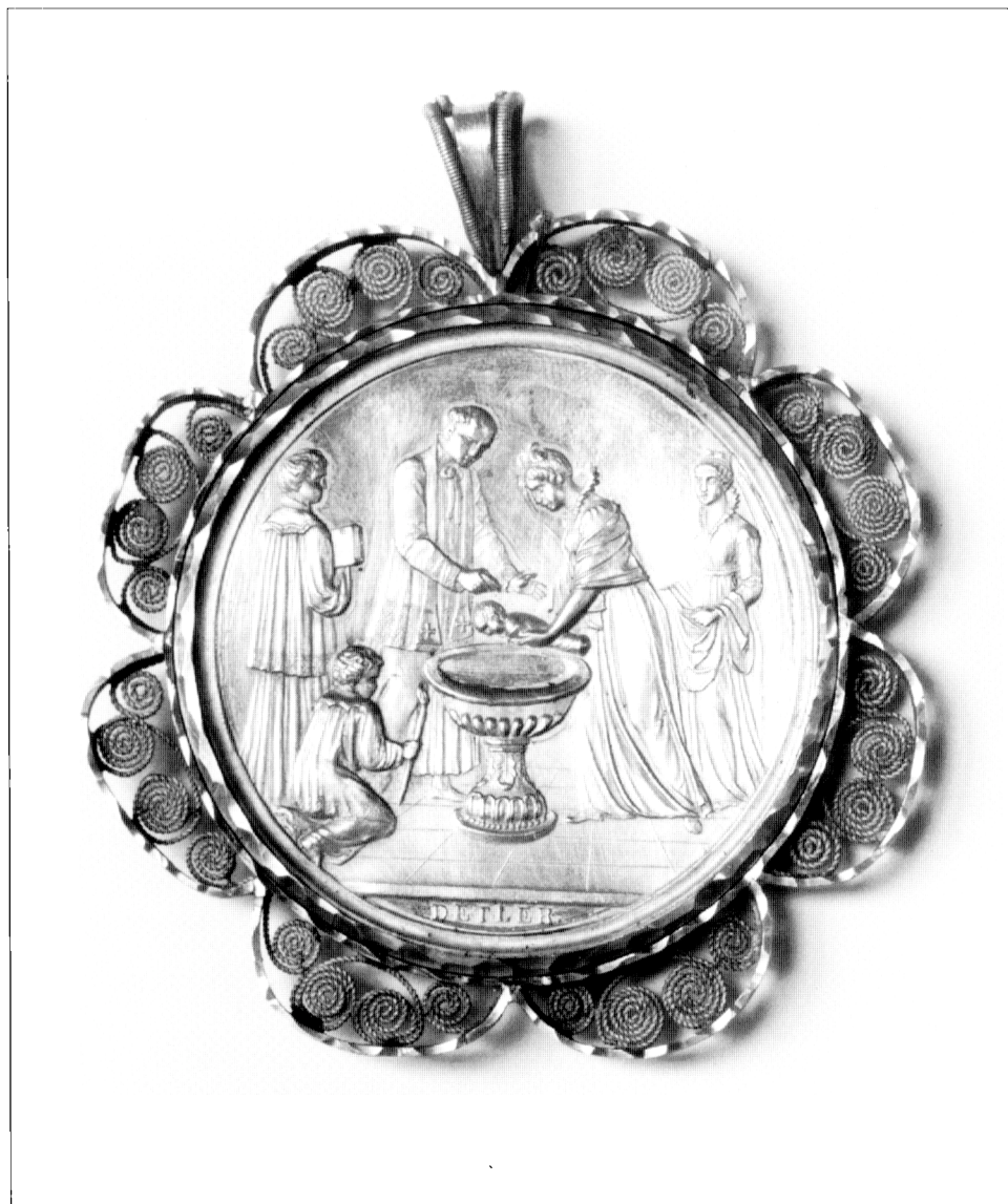
4. Pamětní křestní medaile. Rakousko, Vídeň (Franz Detler), 1818. Moravská galerie v Brně, inv. č. 28459. Gedenktaufmedaille. Österreich, Wien (Franz Detler), 1818. Mährische Galerie in Bün, Inv.-Nr. 28459.