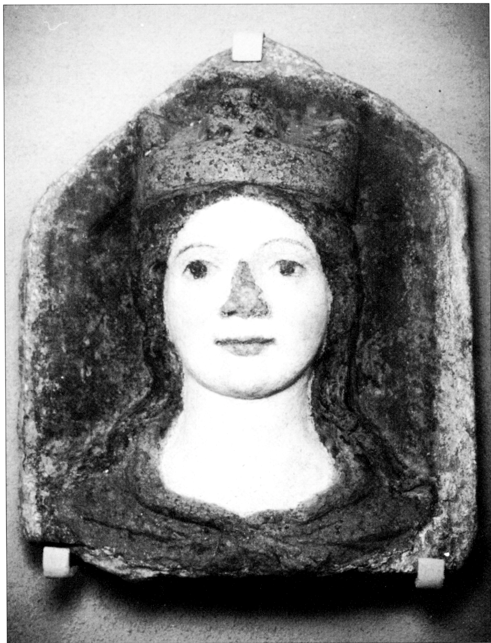
1. Hlava královny ze Znojma. Znojmo, Jihomoravské muzeum. The Head of the Queen from Znojmo. Znojmo, South Moravian Museum.