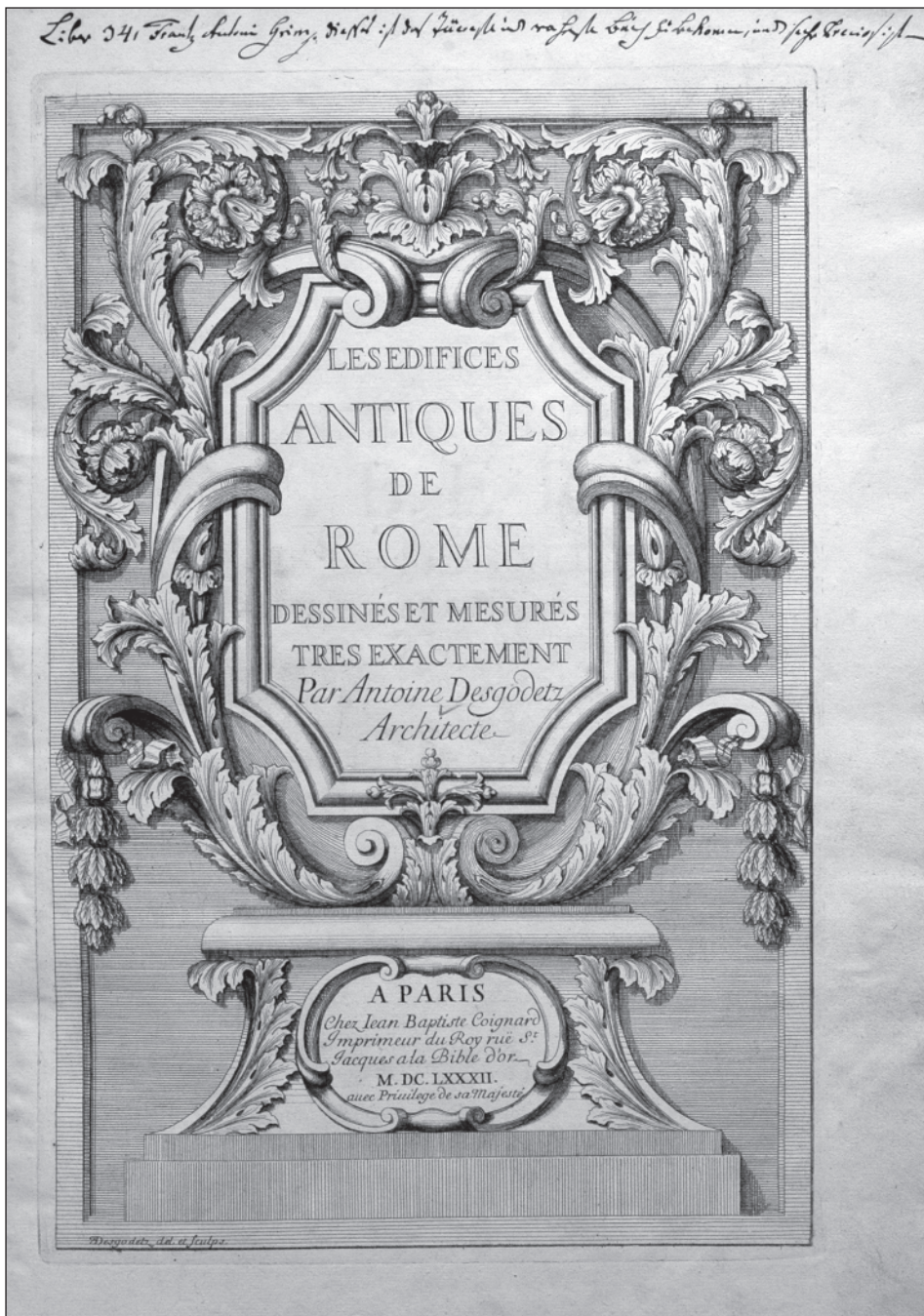
1. Antoine Babuty Desgodetz, Les édifices antiques de Rome, Paris: Jean Baptiste Coignard, 1682 – tituliní list / Tittelblatt [Liber 34]