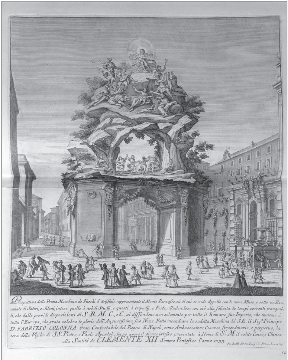
3. Giovanni Battista Sintes, Efemerní slavnostní architektura „Parnas s Apollónem a múzami“ pro ohňostrož / Ephemere Festarchitektur mit Apollon und Museen auf Parnass für ein Feuerwerk, 1733 [Liber 66]