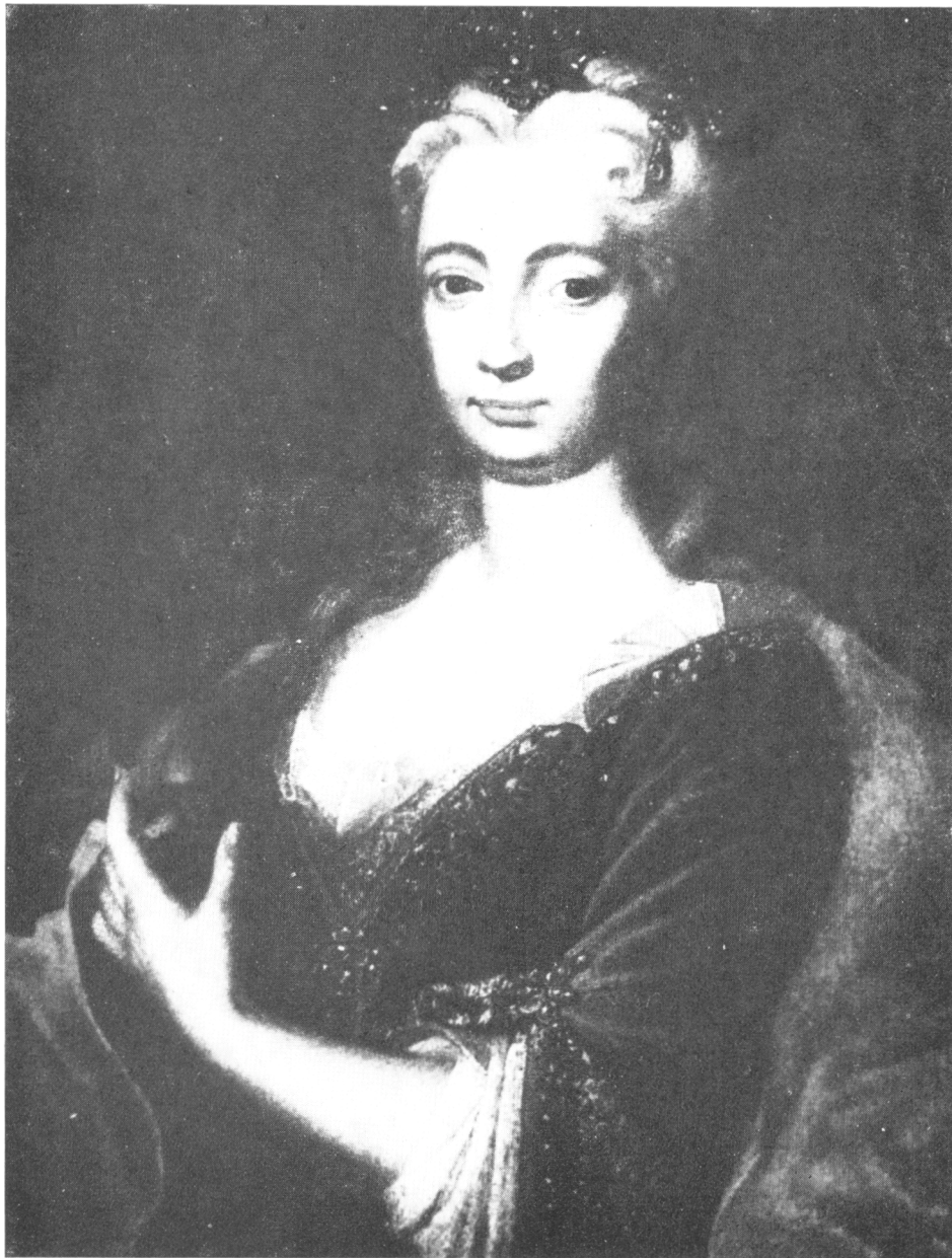
Maria Anna Josefa Pignatelli, Gräfin von Althan (1689—1755).