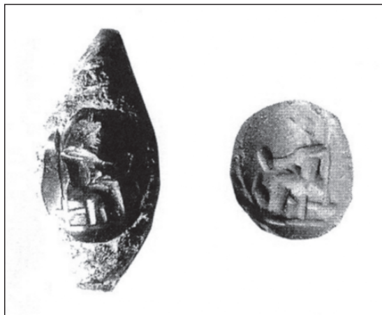
Obr. 3. Římský železný prsten (Form XII) s chrysoprasovou gemou, 2./3. století n. l., Carnuntum (podle DEMBSKI 2005).

se na gemách různého materiálu a barvy (achát, onyx, jaspis, chalcedon, karneol, skelné pasty aj.), a to jak samostatně, tak jako součást vícefigurových kompozic. Coby jednofigurový motiv býval zobrazován sám, bez jakýchkoli dalších atributů (SCHLÜTER – PLATZ-HORSTER – ZAZOFF 1975, Taf. 37: 225; ZWIERLEIN-DIEHL 1973, Taf. 27: 150), nezářídka též s naznačenou mořskou vlnou (KRUG 1995, Taf. 47: 18; ZWIERLEIN-DIEHL 1969, Taf. 88: 502). U zobrazení delfína s trojzubcem se opakují zejména tři varianty, které se liší v postavení a směru trojzubce. Ten může svým ostřím končit buďto nad trupem, ocasní ploutví (DEMBSKI 2005, Taf. 96: 945) nebo může vycházet těsně v oblasti delfínovy tlamy (DEMBSKI 2005, Taf. 96: 944). V každém případě se zdá, že zvířetem trojzubec prochází a delfín je zbraní probodnut.