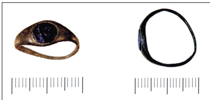
Obr. 1. Bronzový prsten s oválnou vložkou ze skelné pasty tmavě modré barvy. Prosiměřice I, Za mlýnem.

V roce 2005 došlo pomocí detektoru kovů k zajištění bronzového prstenu se skleněnou vložkou (obr. 1, 2). Prsten byl nalezen v Prosiměřicích v poloze Za mlýnem (Mühle Ruiner), jinak označované také jako Prosiměřice I. Osídlení z doby římské v Prosiměřicích 2 je známo v odborných kruzích již od 30. let 20. století, kdy je objevil H. Freising (BENINGER – FREISING 1933, 42; PERNIČKA 1969, 125). Lokalita byla dále sledována v průběhu 20. století (ČERVINKA 1937, 113; BENINGER 1940, 677; TEJRAL 1960, 87–93; PERNIČKA 1966, 147–148; 1969, 125–179; 1970; DROBERJAR 1991; 1997, 173) a rovněž na začátku 21. století (DROBERJAR 2002, 266; TEJRAL 2004; JÍLEK 2007; JÍLEK – VOKÁČ – KOŠTÁL 2007).