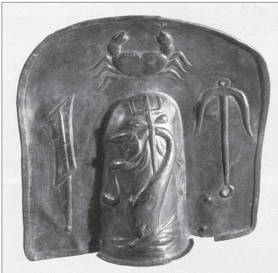
Obr. 4. Galerus pocházející z gladiátorských kasáren v Pompejích. Museo Archeologico Nazionale, Neapol (podle JACOBELLI 2003).

(Fortuny), bývá delfín probodnutý trojzubcem často viděn též v glyptice (např. FURTWÄNGLER 1900, Taf. XXIX: 10). Na gemách jej lze kromě toho najít ve spojení s dalšími atributy této bohyně, s rohem hojnosti a globem (ZWIERLEIN-DIEHL 1991, Taf. 29: 1781), často pak s Eróty (PLATZ-HORSTER 1994, Taf. 3: 14), Apollónovou trojnožkou a havranem (ZWIERLEIN-DIEHL 1991, Taf. 29: 1781), letící Victorií, Merkurovým caduceem a předměty známými z dionýsovského mytologicko-ikonografického okruhu. Obecně lze tedy říct, že se motiv delfína s trojzubcem objevuje v římské glyptice v souvislosti s předměty, mytologickými postavami či zvířaty, které byly chápány jako symboly štěstí, vítězství (popř. vítězství nad smrtí) a blaženého osudu.