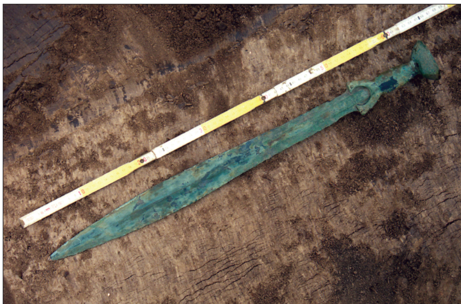
Obr. 3:1. Brno – Královo Pole, okr. Brno-město. Bronzový meč s číškovitou rukojetí.

Ein bronzenes Vollgriffschwert wurde bereits im Jahr 2002 während der Bauarbeiten im Nordteil des Katasters Královo Pole zufälligerweise gefunden. Nähere Fundumstände sind leider unbekannt. Das Exemplar kann man zur vollentwickelten Schalenknaufschwerter, Gruppe mit hoher Knaufschale in der Form eines Kugelsegmentes, Typ ohne Querwülste und ohne Echinus, Variante mit dem Motiv nach der Art des laufenden Hundes in den Zwischenfeldern anreihen (ŘÍHOVSKÝ 2000, 158–161).