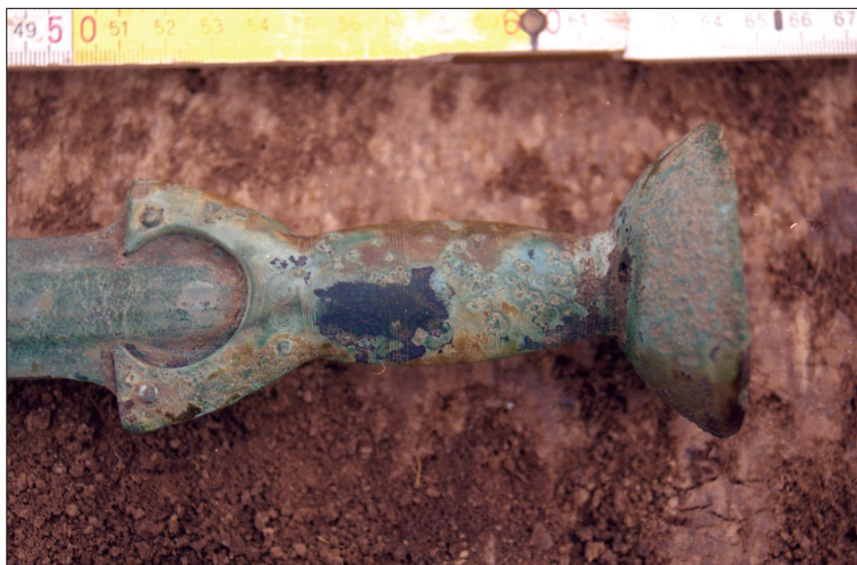
Obr. 3:2. Brno – Královo Pole, okr. Brno-město. Detail rukojeti bronzového meče.