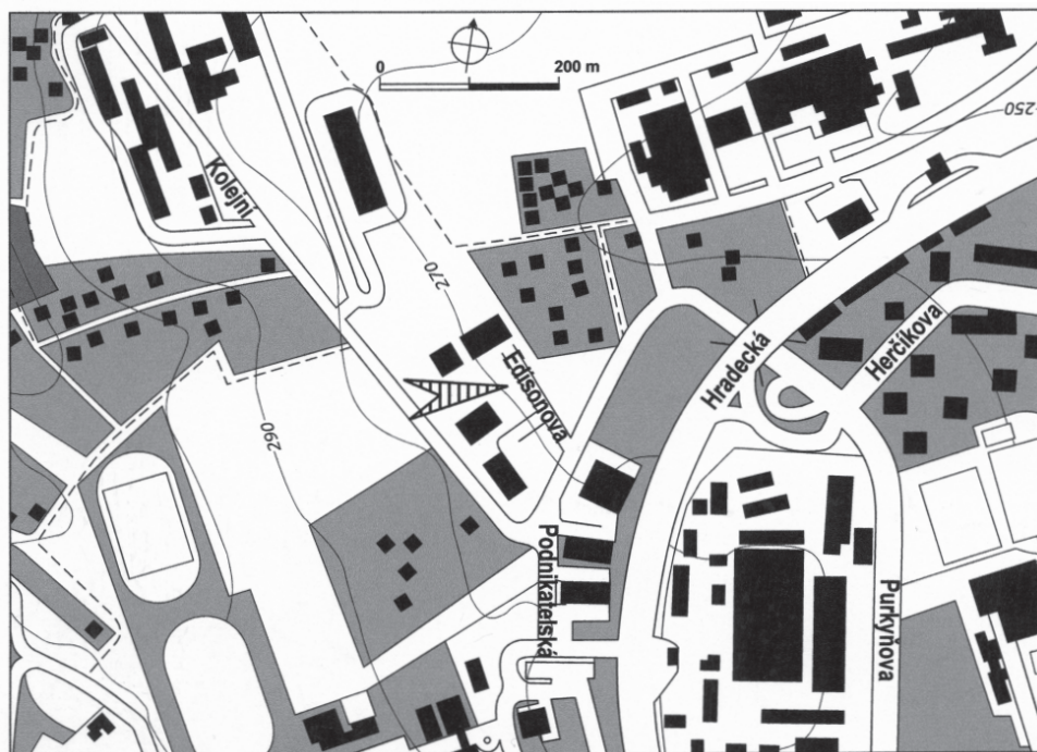
Obr. 1. Brno – Královo Pole, okr. Brno-město. Severní část katastrálního území s vyznačeným místem nálezů bronzového meče.

ké objekty. Pouze poblíž severovýchodního okraje, kde výkop nezasahoval tak hluboko do podloží, bylo nalezeno několik sekundárně přemístěných atypických zlomků pravěkých keramických nádob. Další fragmenty byly získány západně od sledovaného prostoru, podél celého středního úseku Kolejní ulice, jejíž obě strany byly zbaveny jinak souvislého rostlinného pokryvu během nedávné rekonstrukce vozovky a chodníku.