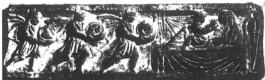
Fig. 2: Adoration des mages. Couvercle du sarcophage au Palais Doria Pamphili à Rome