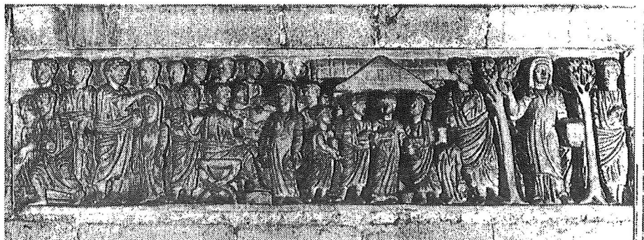
Fig. 5: Sarcophage de la chaste Susanne de l'église Saint-Félix à Geronne