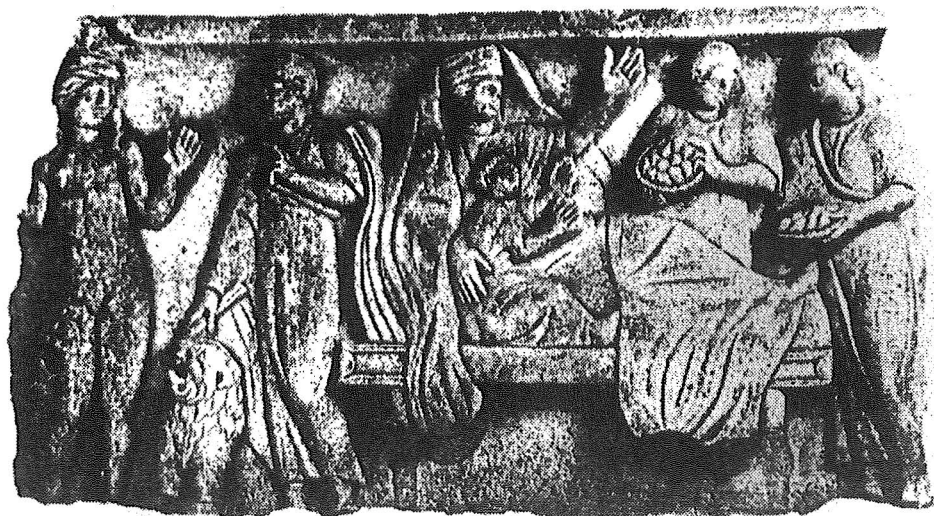
Fig. 1: Fragment d'interprétation discutée découvert à Saint-Bertrand de Comminges