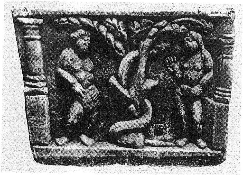
Fig. 3: Petit côté du sarcophage d'Auch — le Pêché originel