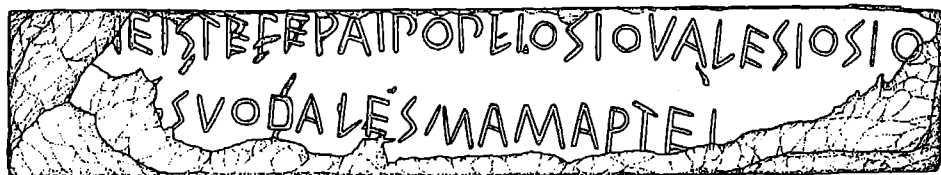
Fig. 4. L'iscrizione da Satricum: Lapis Satricanus

7. (CP) Laminetta bronzea con dedica ai Dioscuri da Lavinium, ductus sinistrorso, un segno circolare di interpunzione, datazione seconda metà del VI sec.