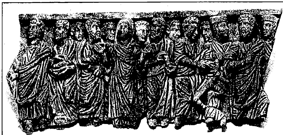
Fig. 1 Fragment du sarcophage constantinien trouvé à Saint-Bertrand de Comminges