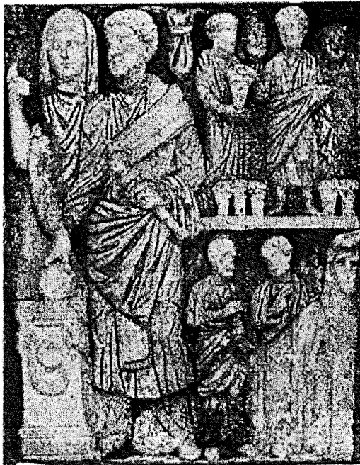
Fig. 4 Fragment du sarcophage de Villa Doria Pamphili, Rep. n° 952