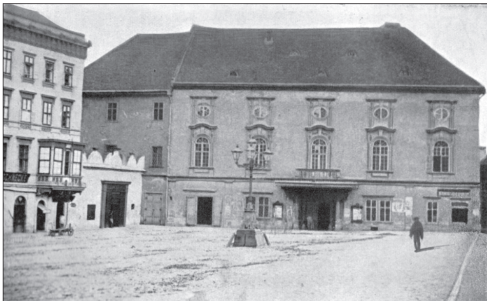
Divadlo Reduta, kde byla v Brně hrána opera do roku 1870, kdy divadlo vyhořelo.