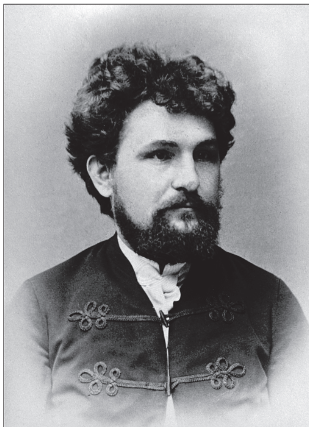
Janáček v době vídeňských studií