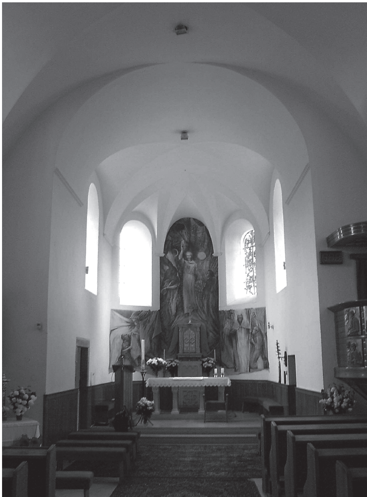
3 – Pohled do interiéru. Dolní Loučky, kostel sv. Mikuláše