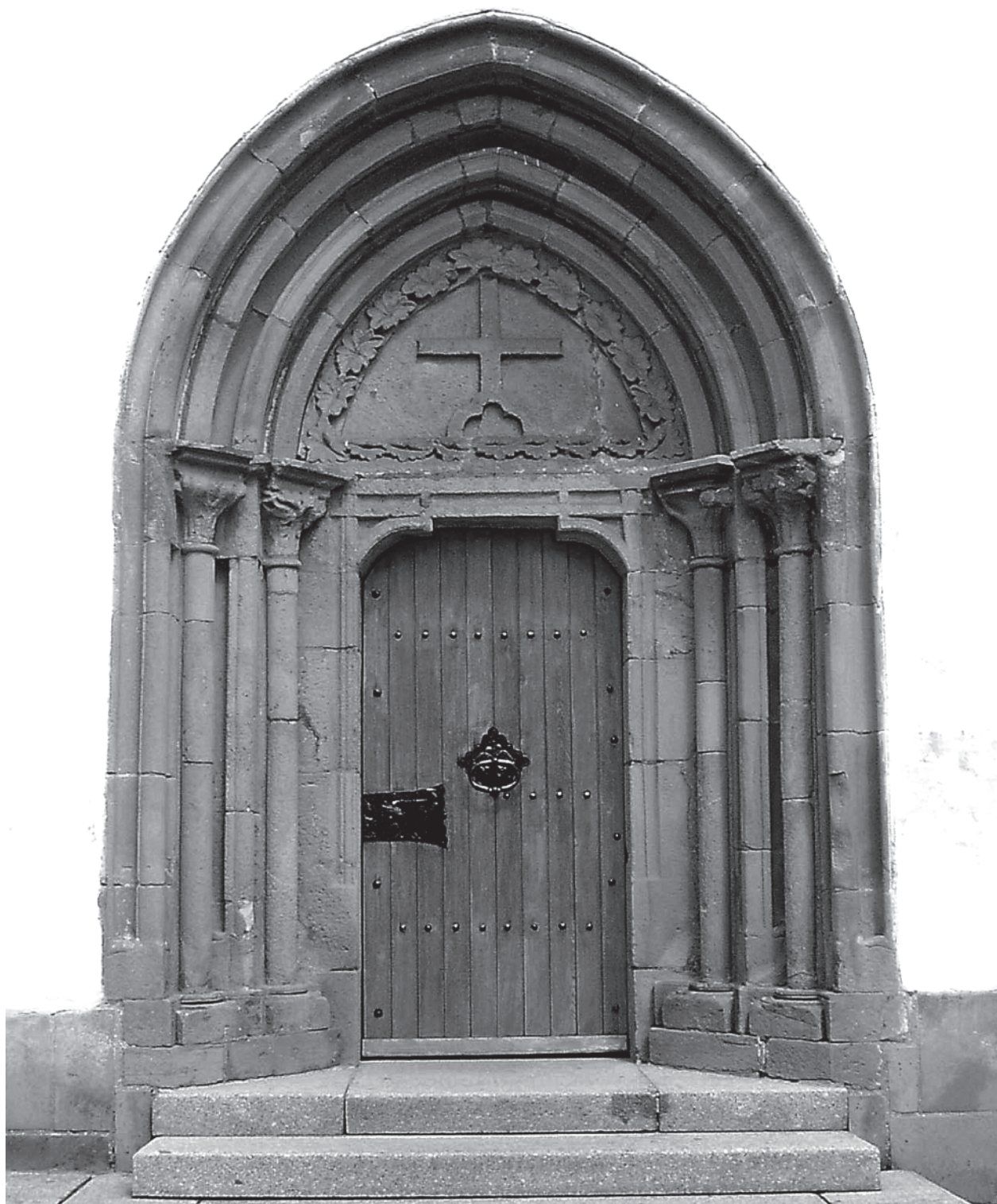
7 – Celkový pohled na západní portál. Dolní Loučky, kostel sv. Mikuláše

Podoba původního portálu se rekonstruuje velmi těžko, variací analogických příkladů dojdeme ke zjištění, že možností je celá řada. Portál svým uspořádáním stál na roz-