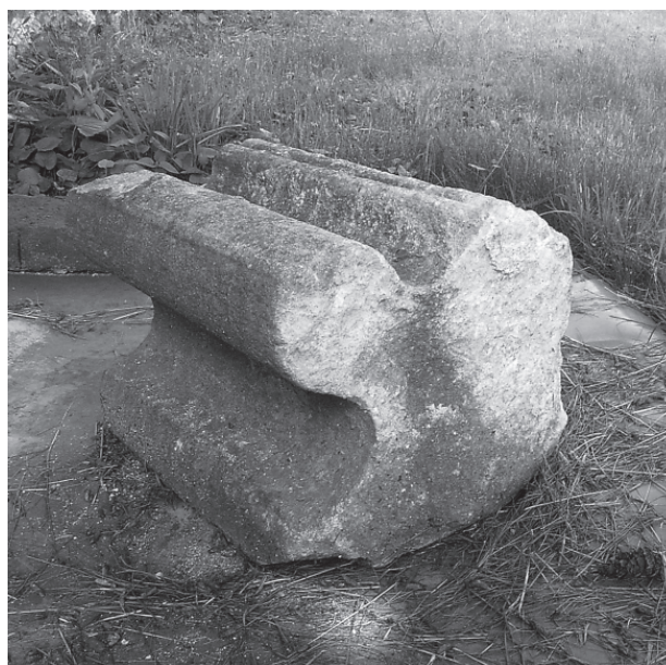
13 – Blok ostění. Dolní Loučky, hřbitov

5. Blízké analogie k raně středověkým památkám se v našem prostředí hledají velmi těžko. Z pozdně román-