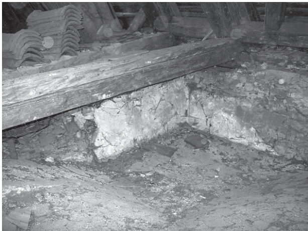
4 – Středověká omítka vystupující nad barokní klenbu lodě. Dolní Loučky, kostel sv. Mikuláše