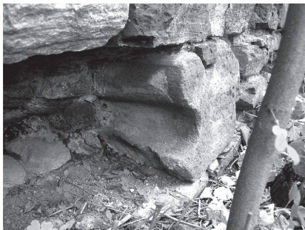
14 – Blok ostění ve hřbitovní zdi. Dolní Loučky, hřbitov

ké patky s mělkým žlábkem a polosloupy ve zdejších trojlodí jsou na úpatí zakončeny výrazným prstencem, jenž je od patky oddělen hlubokým vyžlabením. Tato profilace obíhá v podobě římsy úpatí všech pilířů, z nichž zmíněné polosloupy vyrůstají. Popsaný prvek je ostatně typický pro cisterciácké prostředí, objevuje se i v bazilice v Porta coeli v Předklášteří, kde ho najdeme jak na mezilodních pilířích, tak na úpatí vítězných oblouků bočních kaplí i presbytáře.