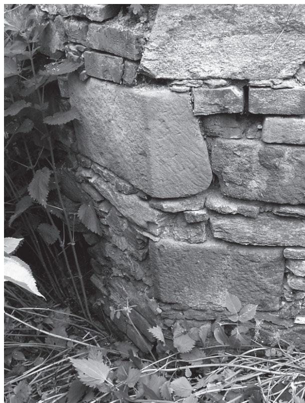
15 – Opracované kvádry ve hřbitovní zdi. Dolní Loučky, hřbitov