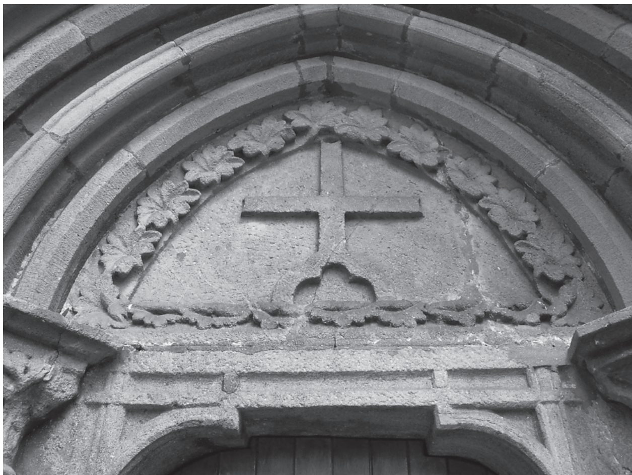
12 – Tympanon západní portálu. Dolní Loučky, kostel sv. Mikuláše

pak v 15. století přiváželi články z daleko méně kvalitního kamene, které navíc podléhají vlivem počasí rychlejší zkáze? Nabízí se vysvětlení, že původní portál nesl jen drobné hlavice, vložené do hloubi ústupku, nebo dokonce jen jednoduchý talíř či prstenec, ústupky s hruškovitou profilací by tak obíhaly celý portál, nikterak nepřerušeny průběžnou římsou. Pro tento typ uspořádání portálové architektury lze nalézt analogie, a to především v českém nebo slezském prostředí. Na konci středověku pak dali stavitelé či stavebníci přednost bohatě zdobeným hlavicím před jednodušší výzdobou. Též se nabízí druhý, méně pravděpodobný výklad, že hlavice byly získány z dílny sídlící v Porta coeli už v polovině 13. století, použitý materiál odlišného charakteru nemusel nikterak vadit, neboť lze předpokládat, že portál byl ve středověku polychromovaný. Musím však podotknout, že na portálové architektuře není po polychromii jediná viditelná stopa.