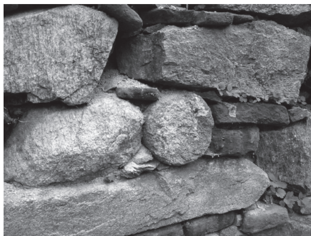
16 – Zlomek sloupku ve hřbitovní zdi. Dolní Loučky, hřbitov

Kde se vzal tak mohutný portál svědčící o moci i bohatství jeho stavebníka? Páni z Deblína náleželi ve 13. století k mocenské špičce, patřili do skupiny nejvyšších moravských zemských úředníků, neboť se v listinném materiálu objevují v pozici brněnských, znojenských, bitovských a hradeckých kastelánů. Jejich pozemkové vlastnictví sice nepatřilo k nejrozsáhlejším, zato se na něm nacházely stříbrné doly. Mohli si tedy dovolit poměrně nákladnou vý-