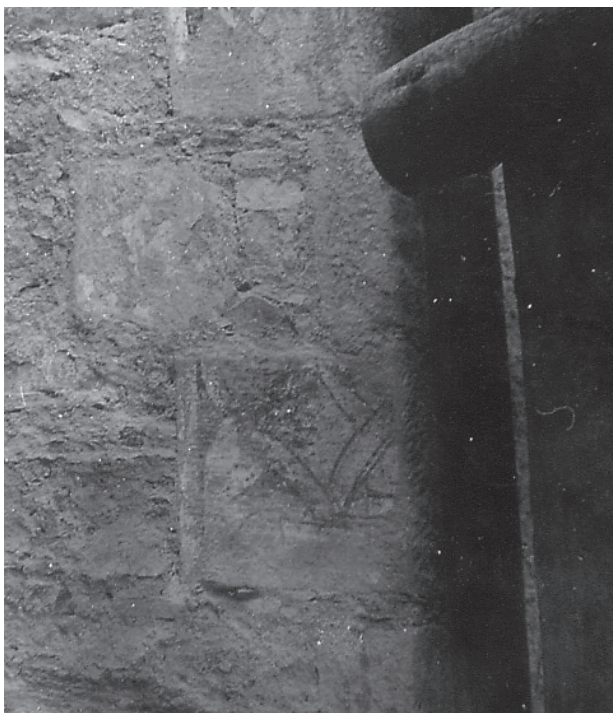
5 – Detail polygonálního závěru. Dolní Loučky, kostel sv. Mikuláše.

vanými ústupky a dvěma sloupky v ostění, se čtyřmi jemně zalomenými archivoltami v horní části a s tympanonem, jenž je položen na orámování vlastního průchodu do podvěží. Sloupky jsou dole zakončeny diagonálně natočenými patkami, nahoře pak kalichovitými hlavicemi. Vnější rozměry portálu jsou 269×385 cm, šířka a výška vnitřního průchodu činí 105×210 cm. Již Albert Kutal si povšiml rozdílů mezi hlavicemi, jež jsou vytvořeny z hrubé arkózy a nesou daleko více