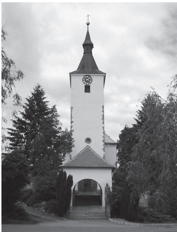
2 – Západní průčelí. Dolní Loučky, kostel sv. Mikuláše

Věž je postavena z lomového kamene, její západní nároží jsou opět armována pravidelnými kvádry z červeného