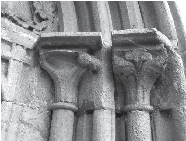
10 – Jižní hlavice západního portálu. Dolní Loučky, kostel sv. Mikuláše