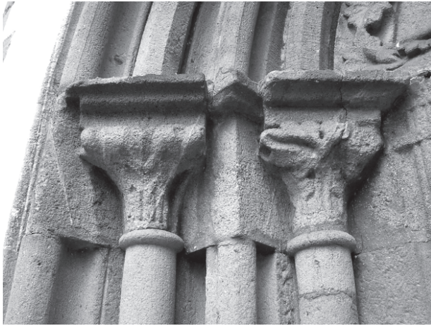
8 – Severní hlavice západního portálu. Dolní Loučky, kostel sv. Mikuláše