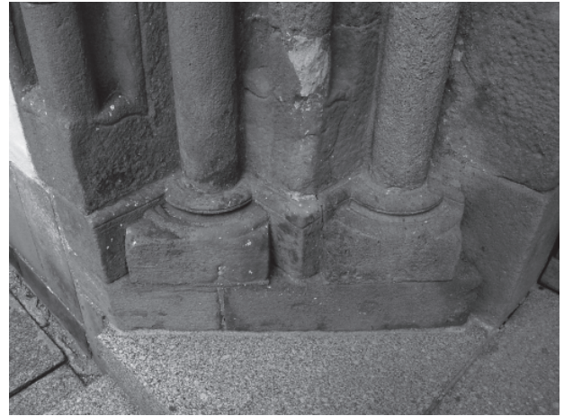
9 – Severní patky západního portálu. Dolní Loučky, kostel sv. Mikuláše