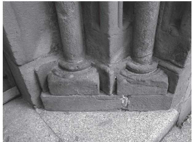
11 – Jižní patky západního portálu. Dolní Loučky, kostel sv. Mikuláše

jež stojí na počátku hruškovité profilace, zde uplatněné na ostění i archivoltách, a diagonální postavení soklové části, které tak vytváří pravidelný trychtýřovitý tvar, svědčí už o vlivu nejranější gotiky. Výše uvedené nesrovnalosti v utváření archivolt vzbuzují domněnku, zda původně nevytvářely oblouk půlkulatý, jenž byl po přenesení na nové místo přerušen, a dnešní lomený oblouk byl tak vytvořen uměle, a to buď na základě dobového estetického cítění, nebo prostě z nedostatku prostoru. Nesmíme taktéž zapomenout, že u některých pozdně románských portálů se jejich šířka vyrovnala výšce. Přenesení takového portálu do předem vymezeného prostoru, jako je západní stěna věže v Dolních Loučkách, by pak znamenalo jeho nutné zúžení. Existuje i druhá možnost, že již původní portál mohl být zalomený, čemuž by napovídaly rovné články uplatněné v archivoltách, zmíněné prostorové omezení by taktéž nedovolovalo jeho plné rozvi-