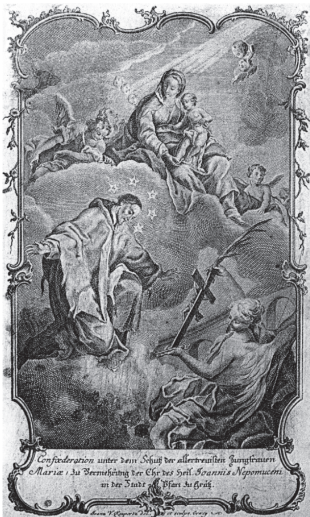
11 – Johann Veit Kauperz, Sv. Jan Nepomucký uctívá krucifix , rytina, 1775

Obdobně nesnadné zůstává také určení autorství původní výmalby letovické lékárny milosrdných bratří. Její vznik nemůžeme předpokládat dříve než ve druhé polovině roku 1762. Poukazuje na to hned vícero záznamů vztahujících se k postupu vlastní stavby a zejména k zařizování interiéru lékárny, zanesených v inventáři a ve stavebním deníku. 83 Částka necelých 360 zl. uvedená mezi výdaji a vyplacená v období mezi 16. zářím 1762 a 18. dubnem 1763 „aus dem Apothecken zu verschiedenen Mahlen“ by mohla, vzhledem k záznamu v inventáři z roku 1763, který hovoří o nové lékárně a jejím vymalování na klenbách, 84 skutečně skrývat proplacení maleb dekorujících dvě menší klenební pole a dvě větší a dvě menší lunetové plochy při obou klenebních polích. Dnešní podoba maleb ovšem prezentuje zásah malíře Josefa Doležela, který svoji obnovovací práci signo-