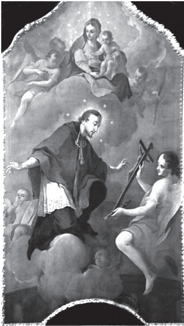
10 – Johann Ignaz Cimbala, Sv. Jan Nepomucký uctívá krucifix , asi 1775. Letovice, klášterní kostel sv. Václava

dentně a záměrně v pozici pendantu ke Sternovu zdařilému a kvalitnímu Portrétu Jana Leopolda hraběte Dietrichsteina . U obou portrétů se přitom dlouhodobě Sternovo autorství traduje, oprávněným se však ukazuje pouze u zpodobení Dietrichsteinova. To můžeme s velkou pravděpodobností ztotožnit s jedním ze dvou jeho portrétů jmenovaných již ve výše citovaném inventáři z 23. dubna 1769, nejspíše s oním z refektáře (druhý portrét je v inventáři zaznamenán v oddíle „dann andere Sachen“). Protějšek, zachycující hraběte Herzana, však dosahuje zjevně nižších kvalit. Je to celkové vyznění vůbec, ale též způsob podání tváře a jejich rysů, prstů či zdobené oděvu, se všemi detaily jejich malířského ztvárnění, které Sternovo autorství vylučují. 69 Přesto je ve vztahu ke Sternově tvorbě zajímavý, neboť zachycuje na v pozadí vyobrazeném kostele sv. Leopolda malířovu dnes již pouze pramenně doloženou výzdobu ve štítu kos-