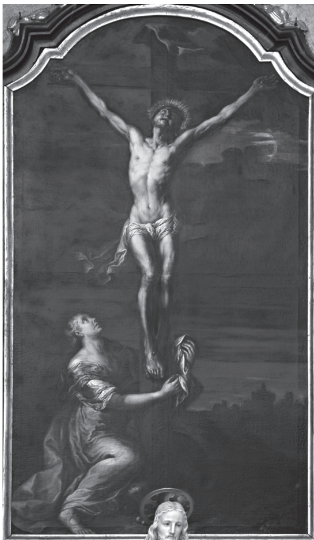
4 – Franz Xaver Wagenschön, Sv. Máří Magdaléna pod křížem , 1759. Valtice, klášterní kostel sv. Augustina

venci 1755 došlo k vyplacení větší částky za vymalování kleneb v kostele a jen o něco pozdějšího data jsou výdaje za malby v sakristii a na klenebních polích pod hudebním kůrem. 25 Oprávněnost připsání těchto maleb Sebastinimu potvrzuje srovnání s jeho dalšími dochovanými freskovými realizacemi, jimiž se na Moravě a ve Slezsku prezentoval, nad to výmalbu v sakristii prostějovského kostela opatřil svým monogramem a datací 1755.