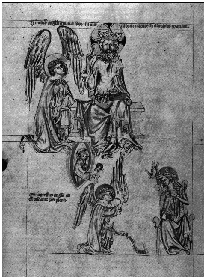
Obr. 2. Legenda sv. Hedviky, Bůh Otec vysílá archanděla Gabriela. Převzato z Krása, J. 1990. České iluminované rukopisy 13.–16. století , Praha: Odeon, str. 79, obr. 39.

je vyjádřena paprskem světla, který vysílá Bůh z nebes (viz Laus Marie , obr. 1), nebo konkrétněji jako dítě, které odává z rozevřeného nebe (obr. 2).