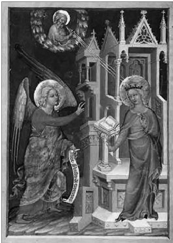
Obr. 1. Laus Mariae, Zvěstování, Praha, Národní muzeum. Převzato z http://ces.mkcr.cz/en/img.php?imgid=1120 [2. 8. 2009]

případných diskrepancí, např. analýzou jednoho rukopisu nebo nástěnného cyklu, ve kterém se objevují, protože je pravděpodobné, že pochází z mechanického přejímání existujících provedení.