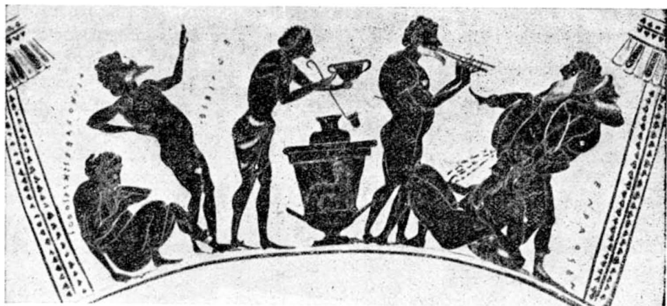
Obr. 20. Pijáci u mšsidla.

vtip s větry. Ovšem tam, kde k tomu bývá vhodná příležitost, se ani Aristofanes tomuto komickému prostředku nevyhnul. Vždyť přes všechnu tendenci byl přece jen básníkem komedie. Takový žert je např. ve scéně, kdy se Trygaios chystá vzletnout na chrobáku na nebe a kdy prosí brouka, aby příliš nesmrděl (P. 87). Vtip bez zvláštní tendence je také v Žabách, kde si při převozu přes podsvětní řeku stěžuje veslující Dionysos na to, že ho začíná bolet zadek (Ra. 221—222), který nakonec komicky zosobňuje: zadek při dalším zohnutí hrozí promluvit (Ra. 238). Jiný případ je opět v Ptáčích (Av. 68), kde Peisthetairos udává jako své vlastní jméno komicky vytvořené jméno, vyjadřující stav, jehož je Peisthetairos nositelem: Epikechodós, tj. Podělaný. Že se s vlastním jménem spojovaly vlastnosti jeho nositele, máme ostatně dosvědčeno i z jiného místa Aristofanova (Nu. 1454—1455: