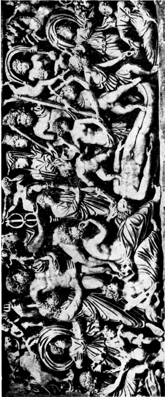
Tab. 5 Prometheussarkophag, Neapel