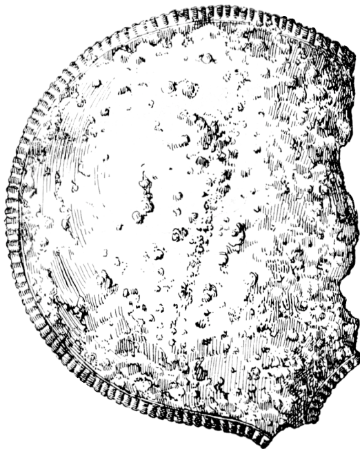
Tab. 2 Le miroir étrusque à Brno (revers et avers)