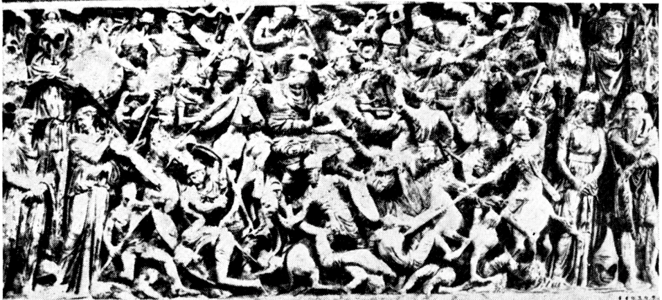
Tab. 3 a. Der grosse Schlachtsarkophag Ludovisi b. Sarkophag von der Via Appia