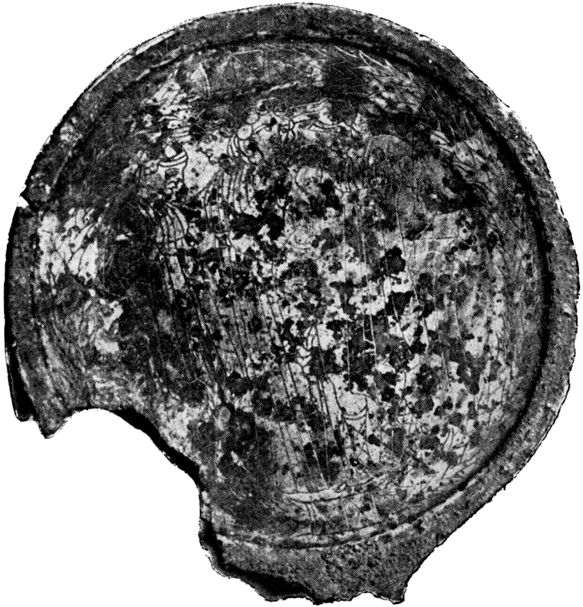
Tab. I Le miroir étrusque à Bino