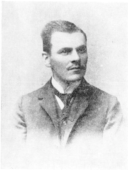
Obr. 1. Josef Tvrđý v roce 1904