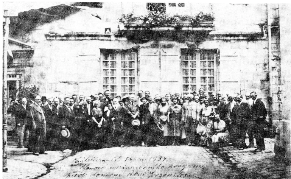
Obr. 5. Účastníci mezinárodního filozofického kongresu v Paříži 1937 (před domem R. Descarta)