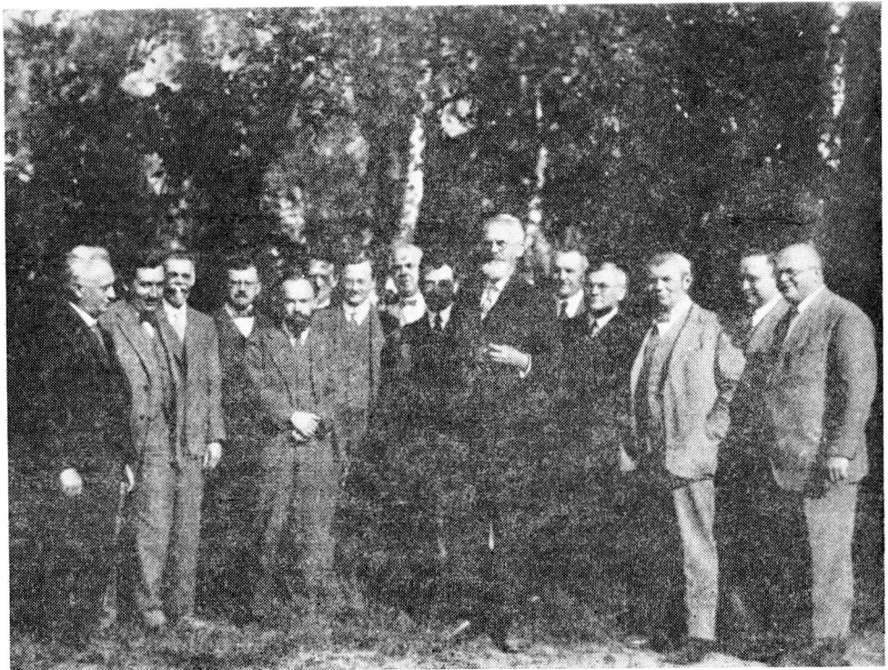
Obr. 3. Profesorský sbor filozofické fakulty Komenského univerzity v Bratislavě (30. léta)