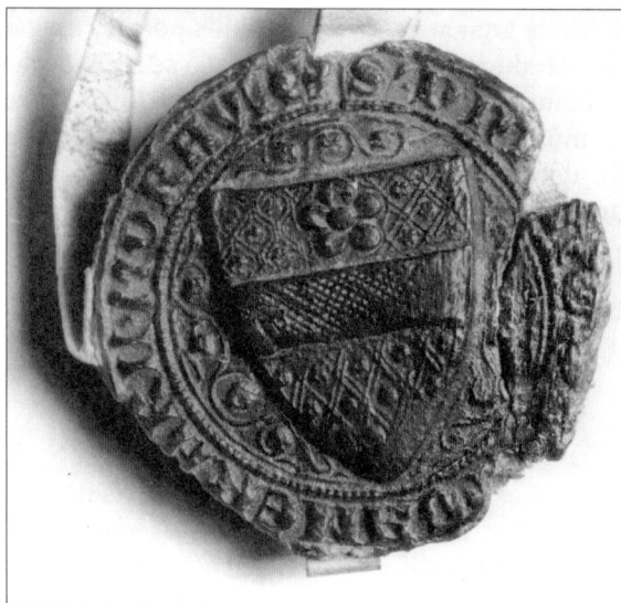
Pečeť moravského podkomořího Jimrama z Ungersberka (Sádku) přivěšená k listině z 23. června 1306. Torzo opisu: + S.,D(omi)NI // // // // CAMERARII.MORAVIE ohlašuje jeho úřad (MZA Brno).

klášterem a městem, dále schvaluje záležitosti týkající se městské samosprávy, zastupuje měšťany – věřitele šlechty (samozřejmě v zájmu komory) na provinciálních soudech, tj. před zemským právem. Technicky také zajišťuje panovníkovy dispozice zeměpanského majetku, převážně půdního, duchovním ústavům a městům (vyměřuje, předává).