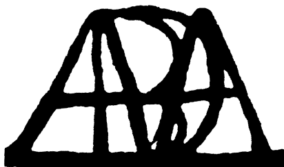
27 • Vivaldiho monogram na četných jeho autografech.

solistově. Epilog závěrečné věty přejímá figurativní postupy skoro „doslovně“. Navazuje v tom na tematiku první věty koncertu. Vivaldi v tomto díle vytvořil vzácné opus, plné náznaků, které směřují k dalšímu vývoji. Je to už Vivaldi „ rokokový “, jenž hovoří, obrazně řečeno, již vlastně jako Mozart .