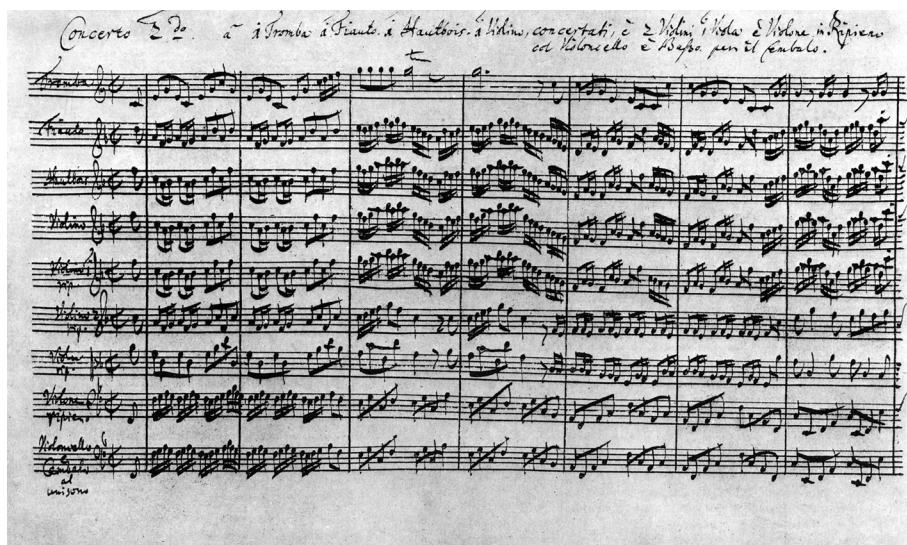
35 • 2. Braniborský koncert, BWV 1047. Autograf, začátek 1. věty. Deutsche Staatsbibliothek, Berlin, sign. Am. B. 78.