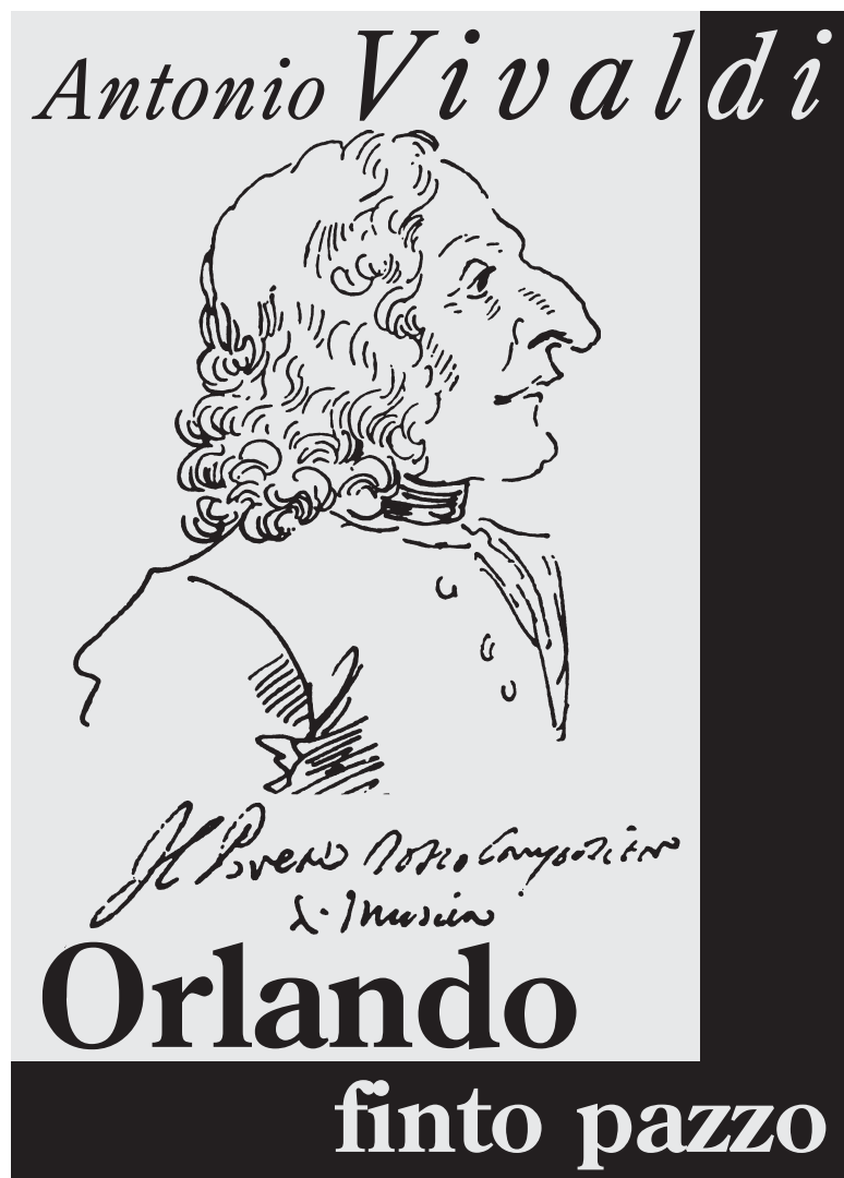
37 • Antonio Vivaldi: Předstírané šílenství. Opera „Orlando finto Pazzo“ byla provedena v Mnichově Hradišti roku 2001. Titulní list programu.