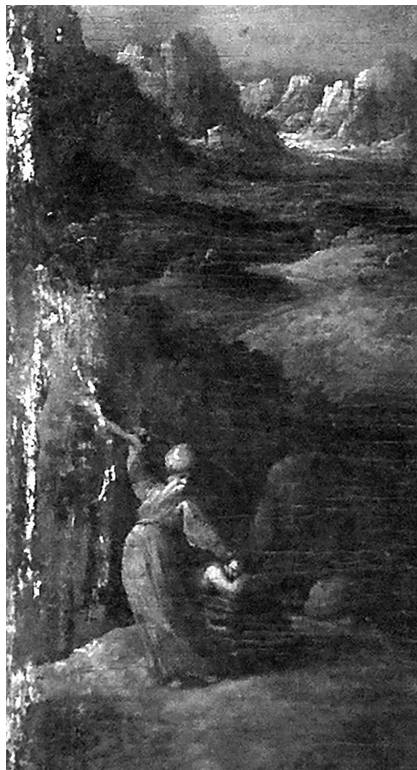
Obr. 4: Gillis Coignet, Charitas, detail pozadí s Abrahamem a Izákem vlevo.

Coignet obohatil Sartovo pojetí také ikonografickými významy. Charitas , tj. Láska, byla chápána jako jedna z významných křesťanských ctností mezi dvěma dalšími – Vírou a Nadějí – a dokonce se jí rozumělo jako nejvýznamnější ze všech tří. Poučuje o tom např. motto na jedné z rytin Johanna Wierixe z roku 1572: „ Manent Fides, Spes et Charitas tria. Haec major autem eorum est Charitas “ (Hollstein č. 1392). Tři dítky, o které Charitas pečuje, vyjadřují pak tři formy lásky – Boží lásku k člověku, lásku křesťana k Bohu a lásku křesťana k bližnímu. 14 V tomto smyslu rozšířil Coignet původní pojetí Andrey del Sarto v drobných scénách v pozadí obrazu. V levé části obrazu je skicovitě zachycen Abraham s Izákem na obětním místě (Gn 22, 9–12), právě ve chvíli, kdy anděl – na obraze silně poškozený – zadržel Abrahamovu ruku [obr. 4]. Nejspíše se tu připomíná Abrahamova zkouška a Boží zákrok, který svou milostí,