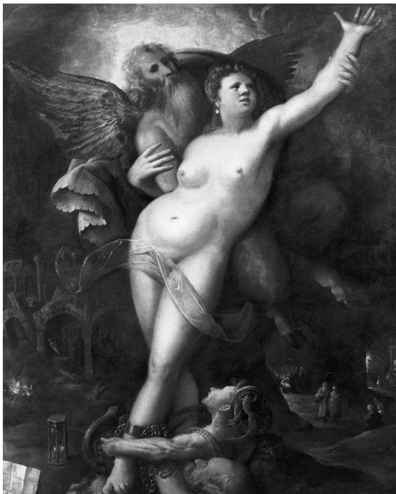
Obr. 3: Gillis Coignet, Unášená Pravda, Milán, Galerie Lodi 2005.

Vrátíme-li se k obrazu z pražské Národní galerie, brzy zjistíme, že i v tomto případě autorovi posloužila starší předloha – freska Andrey del Sarto z atria florentského kláštera Chioostro dello Scalzo, kterou renesanční umělec vytvořil v letech 1515–1520 [obr. 2]. 10 Výškově orientovanou Charitas vložil Sarto mezi čtvercová pole s výjevů ze života sv. Jana Křtitele a zobrazil ji iluzivně v mělké architektonické nische v technice grisaille jako sochu. 11 Pražská Charitas není kopií předlohy v pravém slova smyslu. Je spíše výrazem malířovy snahy o vytvoření její jiné, pozměněné verze, přičemž se dá předpokládat, že originál důvěrně poznal za svého pobytu ve Florencii (1568). Freska v rozměrech 191 x 90 cm mu posloužila k vytvoření díla ve srovnatelné velikosti, což ho nepochybně přiblížilo k monumentálnímu pojetí scény. Modifikoval ji pro potřeby velkého závěsného obrazu, který není vázán na konkrétní architekturu. Je