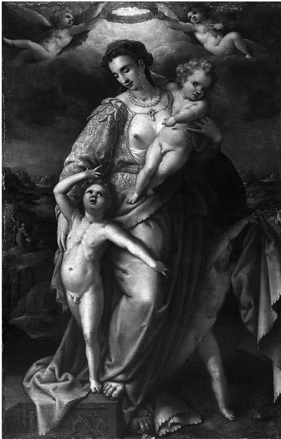
Obr. 1: Gillis Coignet, Charitas, Národní galerie v Praze.