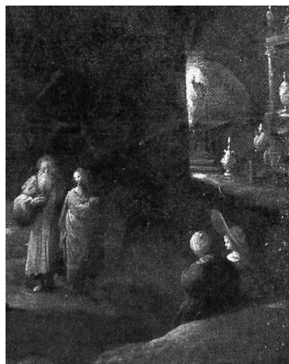
Obr. 5: Gillis Coignet, Unášená Pravda , detail pozadí vpravo.