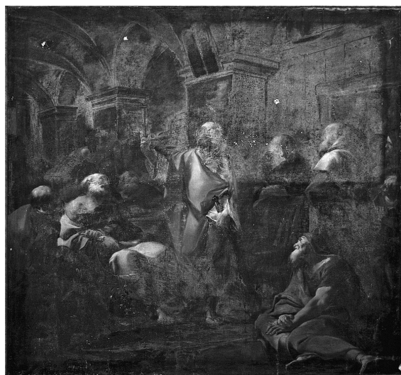
Obr. 5: Sv. Pavel na apoštolském koncilu v Jeruzalémě, 1743, olej, plátno, přibližně 220 x 190 cm, církevní depozitář, Česká republika.