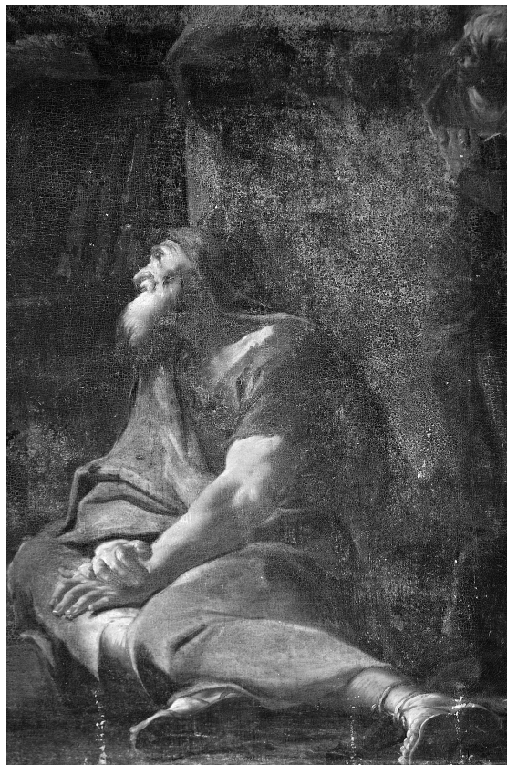
Obr. 6: Sv. Pavel na apoštolském koncilu v Jeruzalémě, detail, 1743, olej, plátno, přibližně 220 x 190 cm, církevní depozitář, Česká republika.