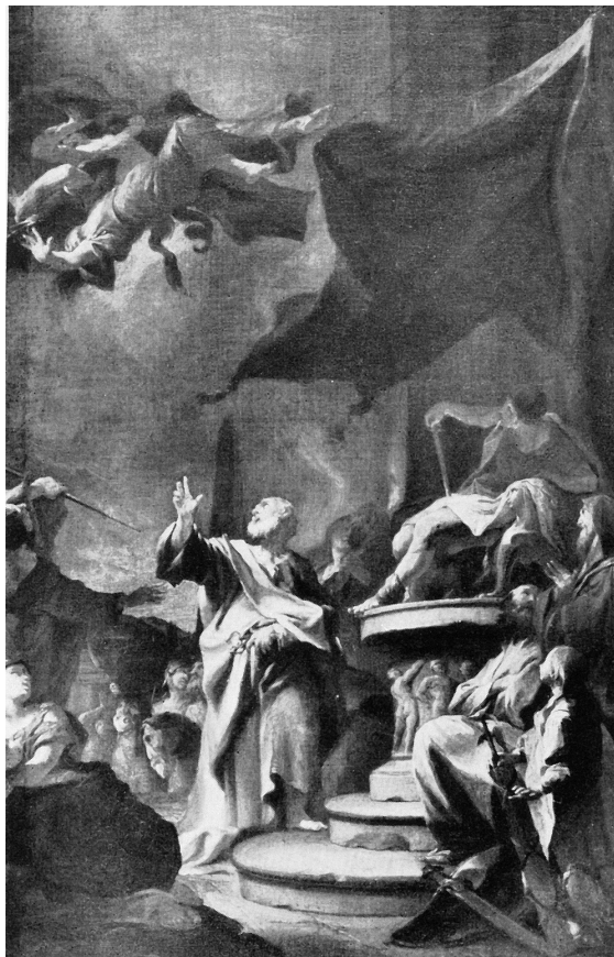
Obr. 2: Sv. Petr při souboji s Šimonem Mágem, před rokem 1743, olej, plátno, 83 x 43 cm, Niederösterreichisches Landesmuseum, inv. č. 3811.