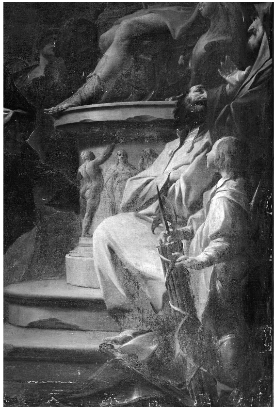
Obr. 4: Sv. Petr při souboji s Šimonem Mágem, detail, 1743, olej, plátno, přibližně 220 x 190 cm, církevní depozitář, Česká republika.