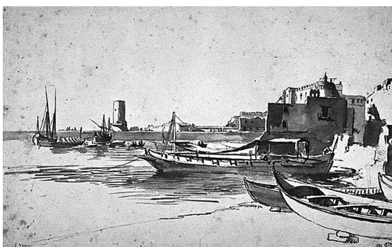
Obr. 3: Claude Joseph Vernet, Bárky v přístavu , kresba, 1748, Louvre, Département des Arts Graphiques, RF 1778.