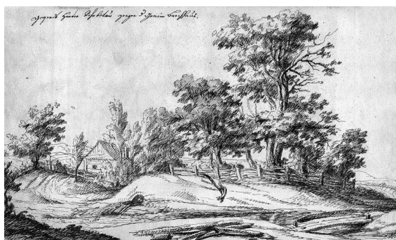
Obr. 2: Dionýs Strauss, Krajina v okolí Šebetova , kresba tuší, 173 x 190 mm, sbírka Arcidiecézního muzea v Kroměříži, inv. č. 13029, sign. B 240.

ho vdově syna, kterého vzkřísil z mrtvých 6 a Hostinu Estěřinu 7 . Vkomponovány jsou do oválných rámců a první dvě jsou šedě lavírovány. Pátá skica Abraháma se třemi hosty byla z alba ve 20. století vyjmuta. Objevila se roku 1979 v olomouckém obchodě se starožitnostmi, odkud byla zakoupena do olomouckého Muzea umění. 8 Obsahově kresby náleží k rukopisu konceptu pro výmalbu první ložnice určené urozeným hostům v šebetovské rezidenci. Vyobrazení nahoře i dole doplňují přípisky. Horní se doslovně shodují s příslušnou pasáží textu ikonografického návrhu. Obsahují stručný popis námětu s odkazem na biblické líčení daného příběhu a znění nápisu, který měl realizovanou malbu doprovodit. Rozsáhlejší poznámky v dolní části folia představují výpisky z Bible, vztahující se úzce k proponované scéně.