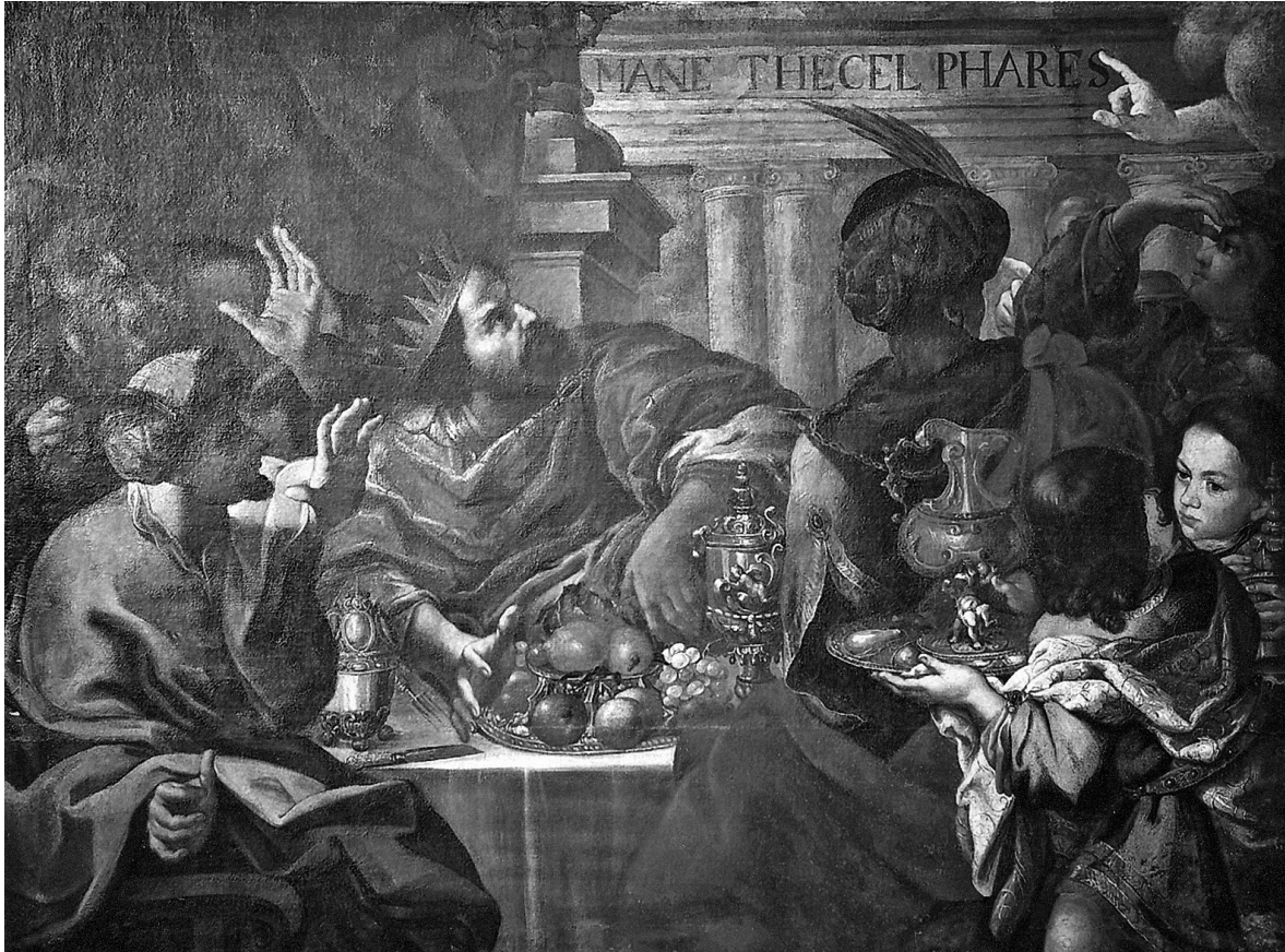
Obr. 5: Jan Černocho, Hostina Belizarova , olej na plátně, 125 x 169 cm, sbírka Arcidiecézního muzea v Kroměříži, inv. č. KE 2963, O 401. Foto: Leoš Mlčák.

se, aby ti bylo příjemně. V bočních zrcadlech bude, v prvním: Letící čáp, jak na zádech nese zpola opelichaného rodiče, kterému zobákem podává potravu (nejspíš žábu). Nápis: Vzácným vzácné . Ve druhém bude čapí hnízdo, ve kterém spokojeně hnízdí také vrabci. Nápis: Otevřeno pro každého . Ve třetím holubník, k němuž se slétají a z nějž vylétají různobarevní holubi. Pod jeho střešou navíc hnízda, která tam mají vlaštovky a vrabci. Nápis: Přebývají pod jednou střešou . Ve čtvrtém slepice, jak pod křídly ochraňuje kuřátka. Nápis: Pod křídly ochraňuje . Nebo slepice, jak sedí na bažantích a kachních vejcích. Nápis: Nejen o své se často postará . Nebo jiná s nápisem Často pečuje o cizí .