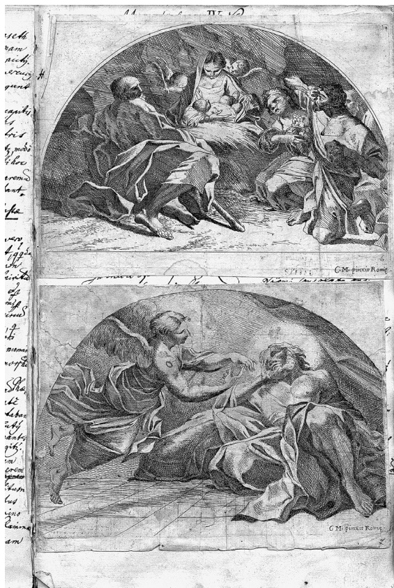
Obr. 1: Carlo Maratta, Klanění pastýřů a Sen sv. Josefa , čárkové lepty, 135 x 192 mm a 140 x 188 mm, sbírka Arcidiecézního muzea v Kroměříži, inv. č. 13029, sign. B 240.