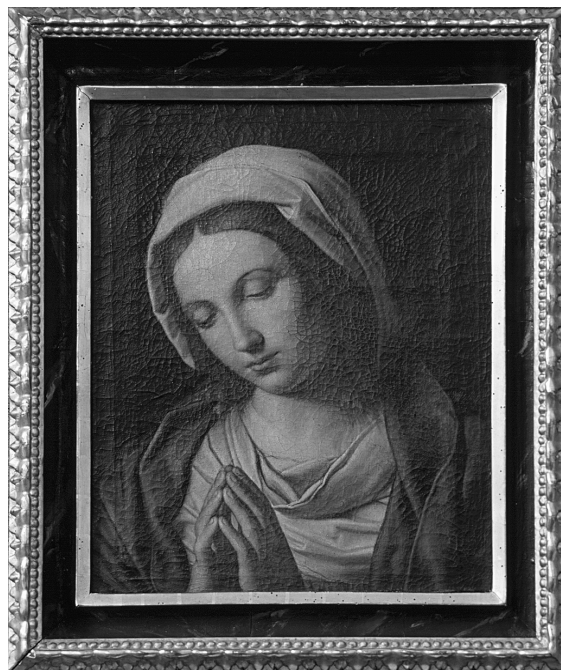
Obr. 2: Giovanni Battista Salvi, zvaný Sassoferato (1609–1685), Madona na modlitbách – kopie, olej, plátno, Brtnice, farní kostel sv. Jakuba Většího.

lečenského života. Byl velitelem benátského Arsenalu, starostou v Bressii, státním inkvizitorem, představeným Rady desíti a generálem v Palmanově (Comandante dell'Arsenale di Venezia, Podestà di Brescia, Inquisitore di Stato, Capo del Consiglio dei X, Generale a Palma). Po vpádu Francouzů do Benátek (a po uzavření míru v Campoformiu roku 1797, který znamenal pro Benátky ztrátu samostatnosti a podle něhož kdysi slavná Serenissima připadla Rakousku) jako velitel pevnosti Palmanova vyhlásil neutralitu. Než aby se vzdal, stáhl se raději do Gorizie a odtud odešel do Vídně, kde se vyznamenal svou neústupností vůči Napoleonovi. U císařského dvora nastoupil dráhu úspěšné kariéry, jejímž vyvrcholením bylo udělení řádu Zlatého rouna a povýšení do knížecího stavu (Principe dell'Impero Austriaco) císařem Františkem I. roku 1822. Od císaře získal