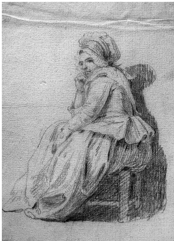
Obr. 6: Charles Parrocel, Sedící žena – studie, první polovina 18. století, kresba rudkou, papír, 208 x 150 mm, Moravská galerie v Brně, inv. č. SDK 421.