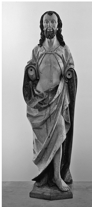
Obr. 7: Švábský sochař, Kristus Vítězný , konec 15. století, Moravská galerie v Brně, inv. č. Z 2707.

Přestože na konci třicátých let sběratelská činnost starohraběte Christiana ze Salm-Reiferscheidtu dle dochovaných dokladů kulminovala, nadcházející historické události měly