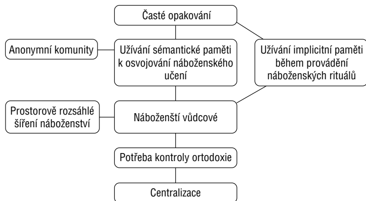
Obr. 2. Doktrinální modus náboženskosti.

řili, musí se tyto doktríny vyznačovat značnou přesvědčivostí. Tohoto účinku je obvykle dosaženo, alespoň částečně, zapojením speciální rétorické techniky, vzniklé v procesu dlouhodobé selekce. Rutinizovaná náboženství jsou obvykle spojena s vysoce rozvinutými formami rétoricky vyjádřené a logicky uspořádané teologie, spočívající na absolutních předpokladech, které nemohou být falsifikovány. 18 Celý systém je pak běžně podbarven jímavými příběhy, které mohou být snadno uvedeny do souvislosti s osobní zkušeností stoupenců. 19