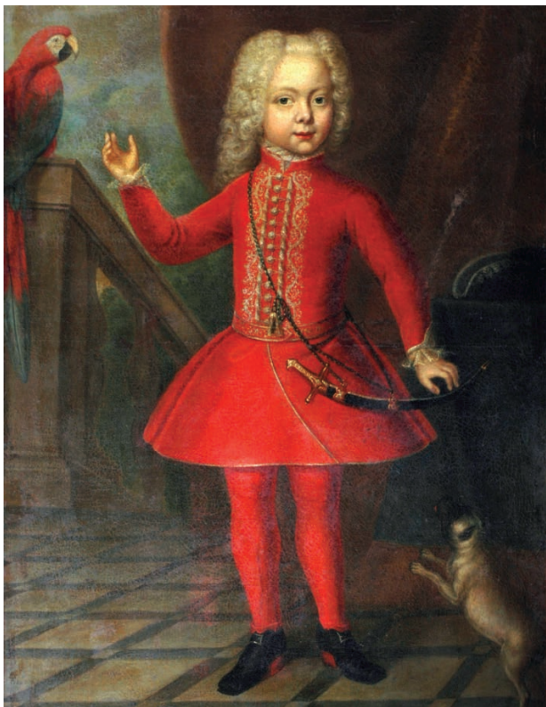
6 – Antonín Karel Josef starohrabě Salm-Reifferscheidt (1720–1769) jako čtyřletý chlapec, kolem 1725. Státní zámek Rájec nad Svitavou