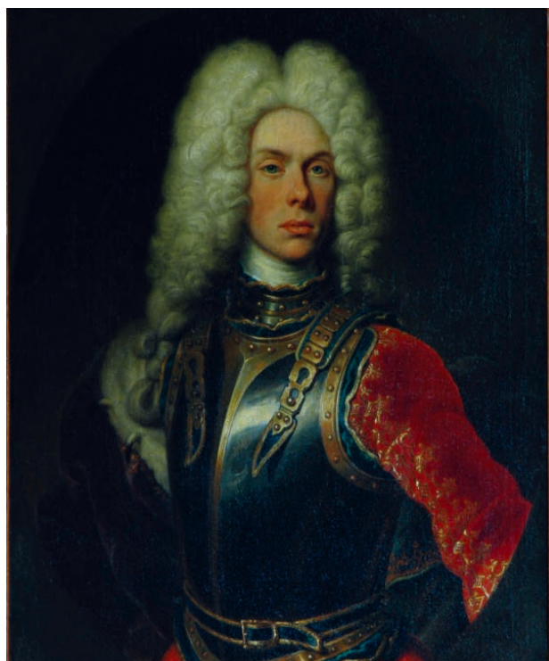
4 – Josef Václav kníže z Liechtensteina (1696–1772), státní zámek Rájec nad Svitavou