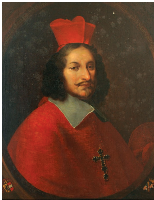
7 – Guidobald hrabě Thun-Hohenstein (1616–1668). Státní zámek Rájec nad Svitavou

ve většině případů ikonografické zařazení jednotlivých děl. V žánrové skladbě obrazové kolekce zaujímají dominantní místo portréty, mezi kterými převládají rodinné podobizny, jež doplňuje také několik ukázek specifického žánru studijních hlav (74 obrazů). Významný podíl představují náboženské kompozice, a to jak starozákonní výjevy, malby inspirované Novým zákonem, tak dále mariánská a kristologická témata a obrazy světců (64 obrazů). Další výraznou skupinu tvoří nejrůznější typy zátiší, mezi nimiž jsou nejpočetnější květinové kompozice (40 obrazů), ke kterým lze připojit 45 Papierene Bilder, worauf Blumen und unterschiedliche Figuren gemahlen . Padesát krajinných výjevů tematicky doplňuje 6 mořských krajin a 5 architektonických obrazů. Výraznou skupinu v ikonografické struktuře obrazové kolekce tvořily obrazy s portréty koní a díla s námětem jízdáren, scén s figurami jezdeckých škol nebo zobrazení stájí, které byly soustředěny především v „malém sále“ – vestibulu před hlavním sálem (34 obrazů). Vedle oblíbeného námětu koní nechyběly také animalistické obrazy (13 obrazů). Mezi alegorickými výjevy, které jsou velmi vágně popsány, vynikají svou četností náměty čtyř ročních období a dvanácti měsíců. V obrazové sbírce nechyběly ani žánrové scény (22 obrazů), příběhy z antické historie (15 obrazů). Námětovou rozmanitost kolekce dotvářejí dále bitevní scény a obrazy