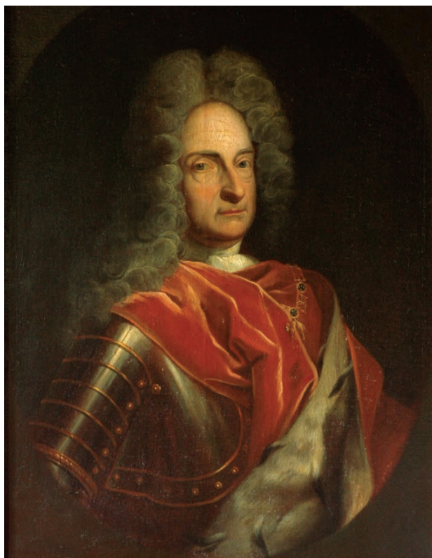
2 – Antonín Florián kníže z Liechtensteina (1656–1721). Státní zámek Rájec nad Svitavou