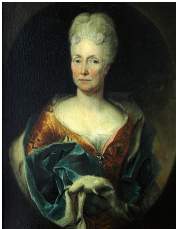
3 – Eleonora Barbora kněžna z Liechtensteina, roz. hraběnka Thun-Hohenstein (1661–1723). Státní zámek Rájec nad Svitavou