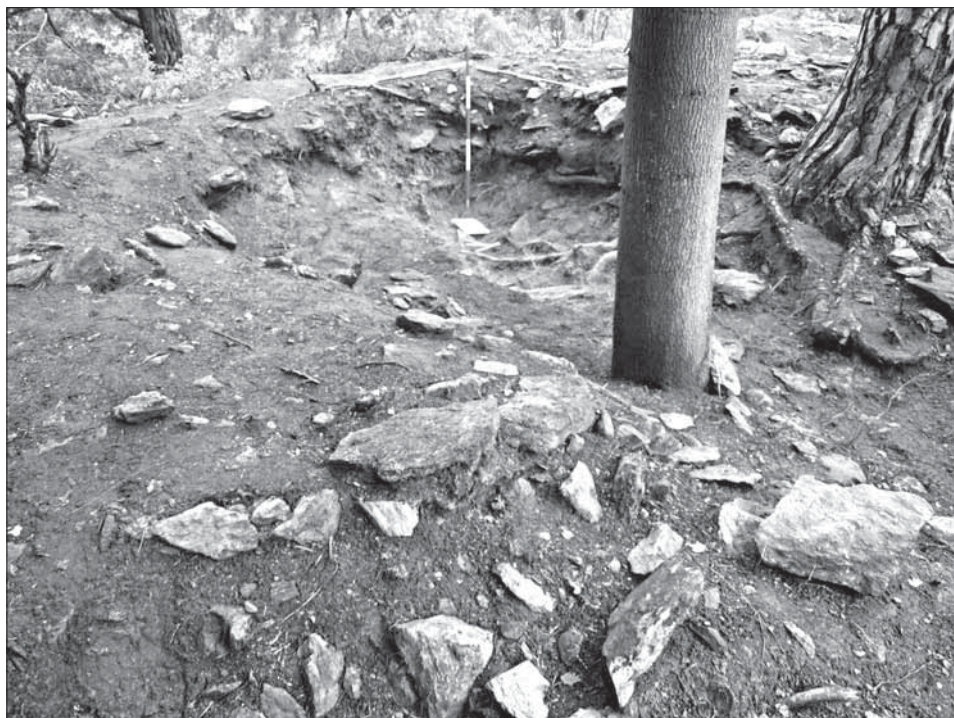
Obr. 8. a 9. Okop pro kulomet a okop pro KPÚV po odkryvu. Opět je patrné použití kamenů z výstavby na předprsně okopů.