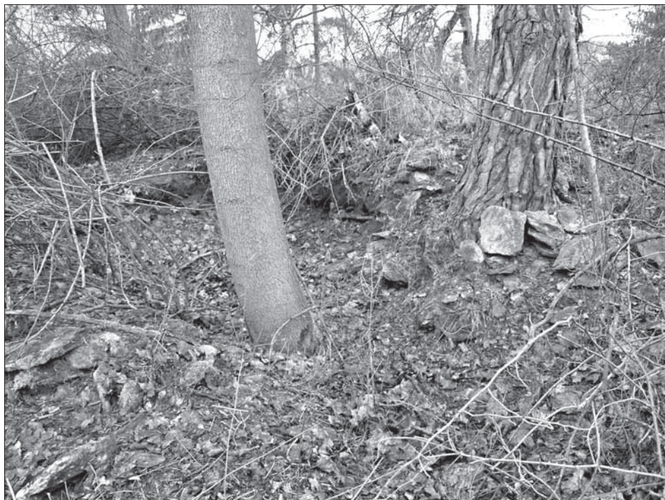
Obr. 1. a 2. Okop pro kulomet a okop pro KPÚV, stav na jaře 2010. Bujná vegetace znesnadňovala nalezení objektů. Abb. 1. und 2. Schützengraben für ein Maschinengewehr und Schützengraben für eine Panzerabwehrkanone, Stand Frühjahr 2010. Das Finden der Objekte wurde durch die üppige Vegetation erschwert.