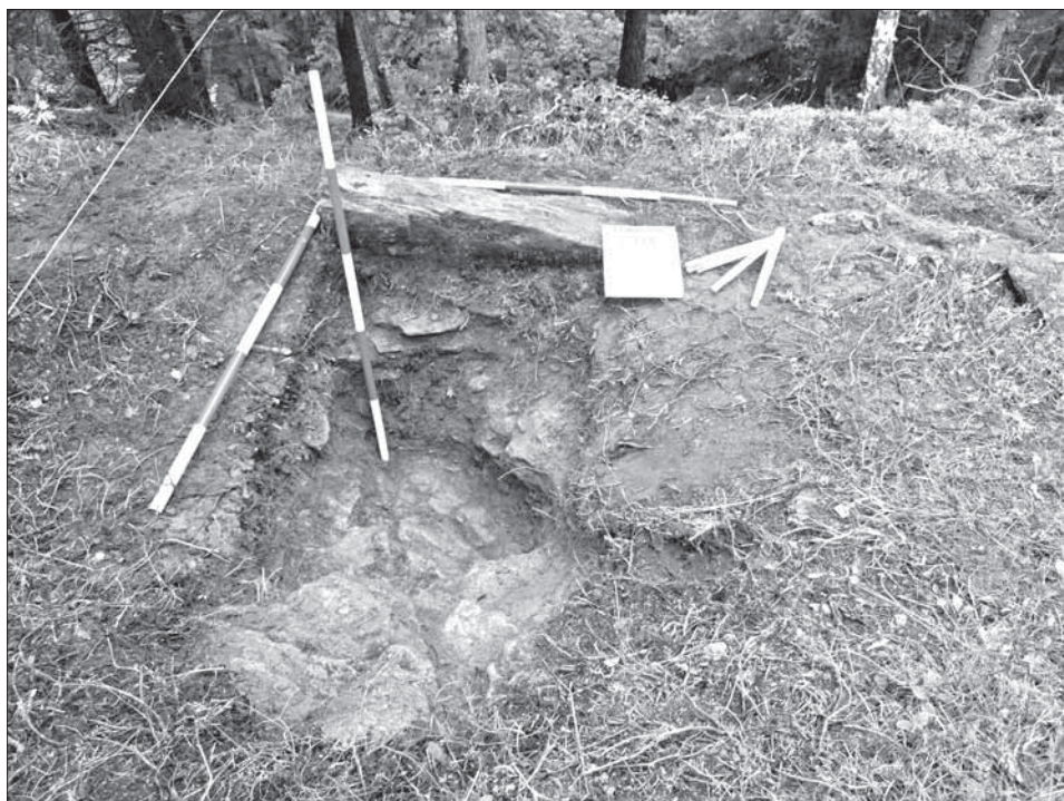
Obr. 3. a 4. Okop pro klečícího střelce z pušky před výzkumem a po odkryvu poloviny objektu, zajímavý je velký kámen použitý k ochraně střelce.