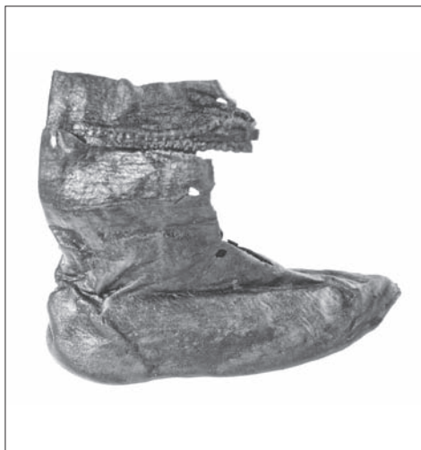
Obr. 10. Košice, Hlavná 96. Zachovaný exemplár koženej obuvi z výplne obj. 2/11.