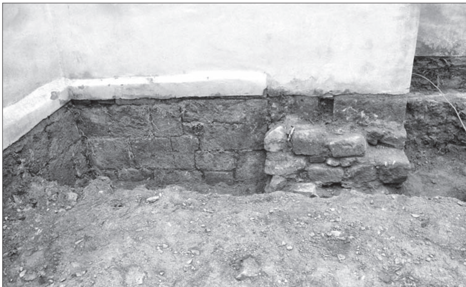
Obr. 7. Bukovec, okr. Domažlice, kostel Nanebevzetí Panny Marie. Západní stěna kostela. Vlevo zdivo románského průčelí, vpravo rozšířený předzáklad gotické lodi. Foto M. Čechura, 2009.