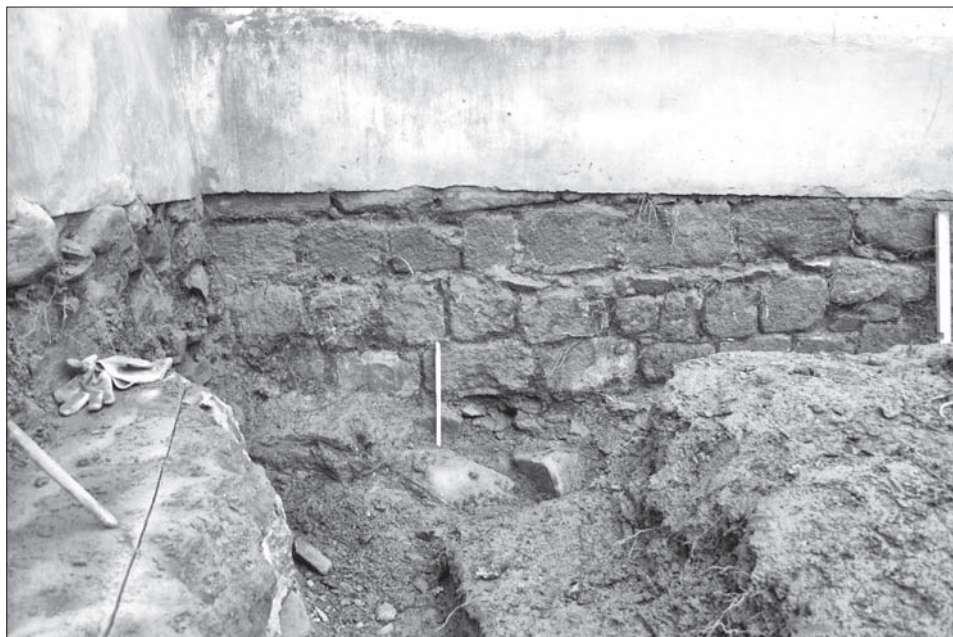
Obr. 6. Bukovec, okr. Domažlice, kostel Nanebevzetí Panny Marie. Jižní stěna lodi zděná z druhotně použitých románských kvádrů. Vlevo kvádrík se zbytky polychromie. Foto M. Čechura, 2009.