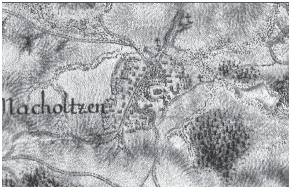
Obr. 1. Bukovec, okr. Domažlice, kostel Nanebevzetí Panny Marie. Kostel s příkopem na prvním vojenském mapování, 1764–1768. 1 a Militärliche Survey, Section No. 172, Austrian State Archive/Military Archive, Vienna.