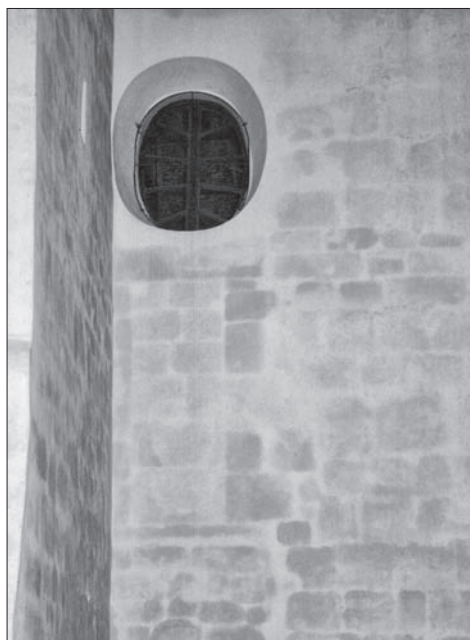
Obr. 8. Bukovec, okr. Domažlice, kostel Nanebevzetí Panny Marie. Portál na tribunu v západní stěně lodi. Vpravo patrná trhlinka vzniklá při odbourání jižní stěny lodě. Foto M. Čechura, 2009.

K upřesnění vzniku a trvání stavby jen nepřímou přispívají keramické nálezy. Ze sond 2/03 a 2/09 bylo získáno značné množství keramických zlomků (řádově několik set). Tato výrazná koncentrace prostorově odpovídá interiéru kamenné stavby. V ostatních sondách ani v další trase drenážního výkopu množství keramiky nepřesahovalo řádově jednotky, maximálně desítky kusů, což je množství obvyklé při výzkumu kostelních hřbitovů. Lze proto předpokládat, že prostorová shoda kamenné stavby a zvýšeného množství keramiky není náhodná a souvisí s provozem stavby. Výpovědní schopnosti nálezového fondu jsou bohužel omezeny výše popsanou stratigrafickou situací opakovaně narušovanou mnohačetným pohřbíváním. Keramika z výzkumu zatím nebyla zpracována, avšak lze se na tomto místě pokusit o předběžné vyhodnocení. V souboru převažuje silnostěnná a hrubozrnná keramika, zčásti vytáčená na kruhu, zčásti robená v ruce a obtáčená. Běžným tvarem jsou hrnce, nejčastěji s různými formami vzhůru vytažených okrajů, poměrně často se objevují pokličky. Výzdoba je většinou rytá, jen vzácně se objevuje jednoduchá vlnice. Chronologicky lze soubor zasadit převážně