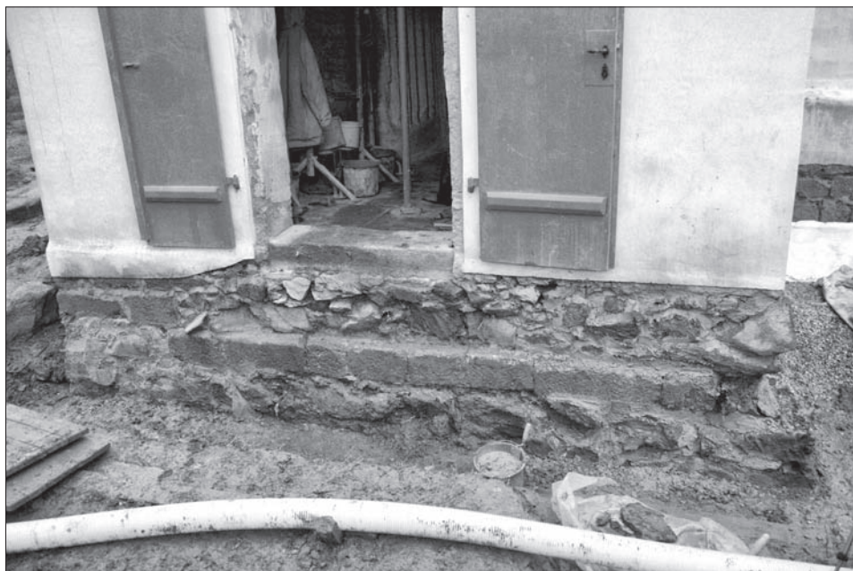
Obr. 5. Bukovec, okr. Domažlice, kostel Nanebevzetí Panny Marie. Zdivo románské přístavby použité jako základ barokní předsíně.