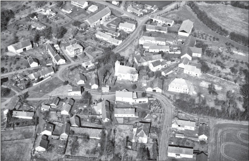
Obr. 2. Bukovec, okr. Domažlice. Letecký pohled. Foto M. Čechura, 2007. Abb. 2. Bukovec, Bez. Domažlice. Luftaufnahme. Foto M. Čechura, 2007.

a novému vyhodnocení předchozích sond; další, rozšiřující sondáž pak umožnila upřesnit nejednoznačnou interpretaci tehdy získaných poznatků (Čechura 2007, 471; Kaigl 2007, 463).