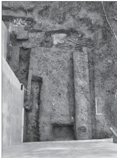
Obr. 4. Bukovec, okr. Domažlice, kostel Nanebevztí Panny Marie. Románské přístavba, pohled z věže kostela. Foto M. Čechura, 2009.

Pro sledování stratigrafického vztahu mezi touto zdí a románskou věží byla v místě jejich styku položena sonda 2/09 o rozměrech 100 × 150 cm. Bohužel sled vrstev byl v důsledku intenzivního pohřbívání zcela nečitelný a projevoval se jako homogenní hřbitovní vrstva. Nalezené pohřby patřily převážně novorozencům a věkové kategorii infans I. Koruna základu nalezené stavby byla o cca 15–18 cm výše než koruna základu věže. Nadzemní zdivo bylo strukturou totožné. Situace svědčí o sekundárním připojení stavby k již stojícímu kostelu. Vznik stavby lze datovat pouze obtížně. Struktura zdiva shodná s kostelem, niveleta základového vkopu i zjevná vazba ke kostelu a jeho komunikačnímu schématu naznačuje, že časový odstup od vzniku kostela nemohl být příliš velký.