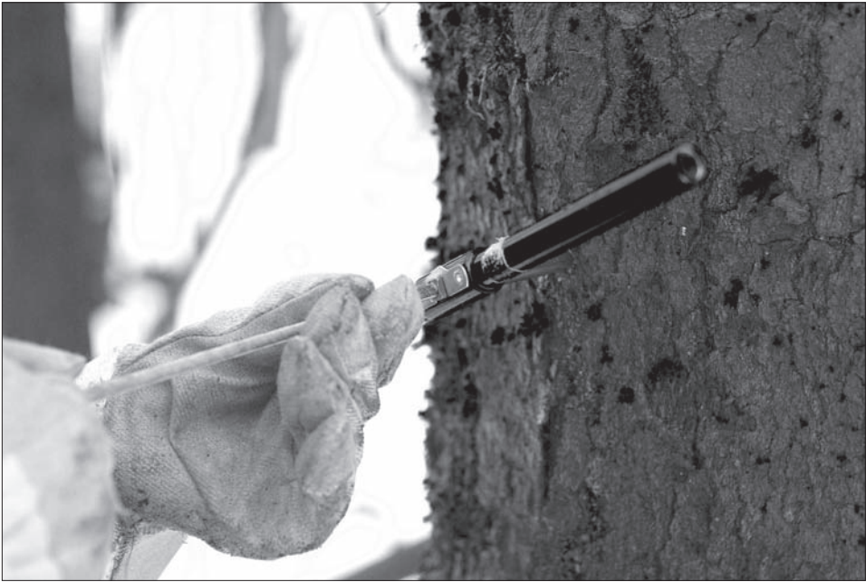
Obr. 1. Odběr vzorku pomocí Presslerova přírůstového nebozezu. Foto L. Funk. Abb. 1. Probenentnahme mithilfe eines Presslerschen Zuwachsbohrers. Foto L. Funk.