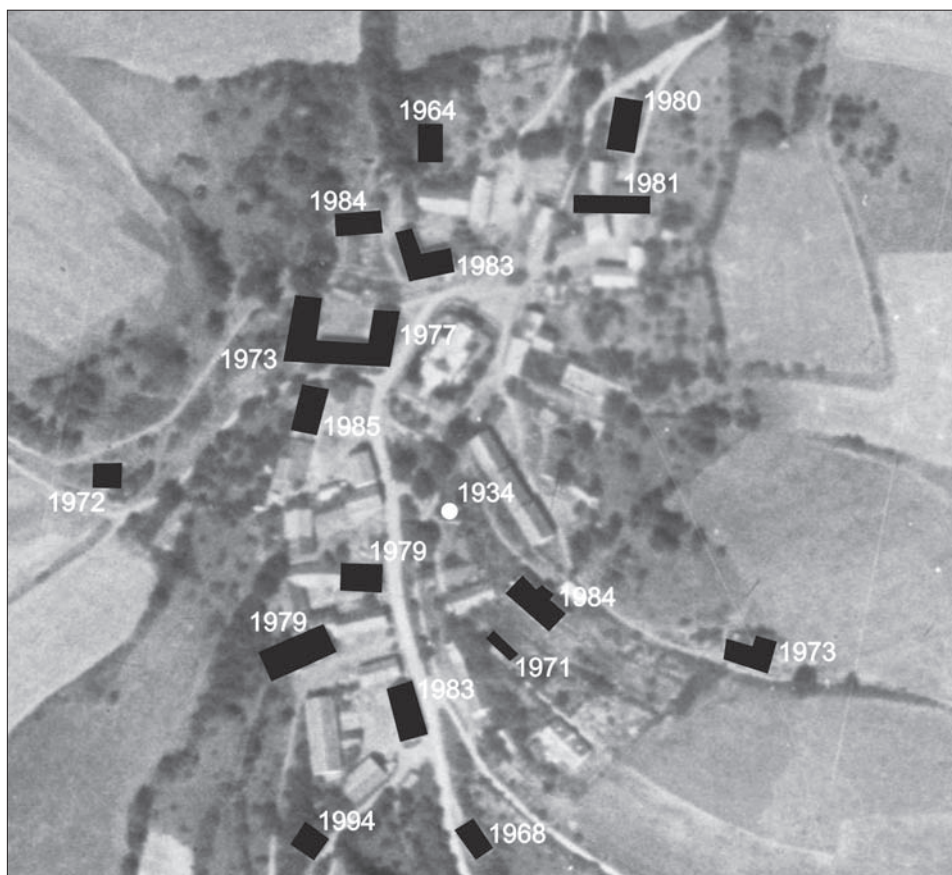
Obr. 5. Zaniklá vesnice Skoky. Schéma objektů datovaných pomocí dendrochronologie živých stromů. Schéma L. Funk, M. Váňa.