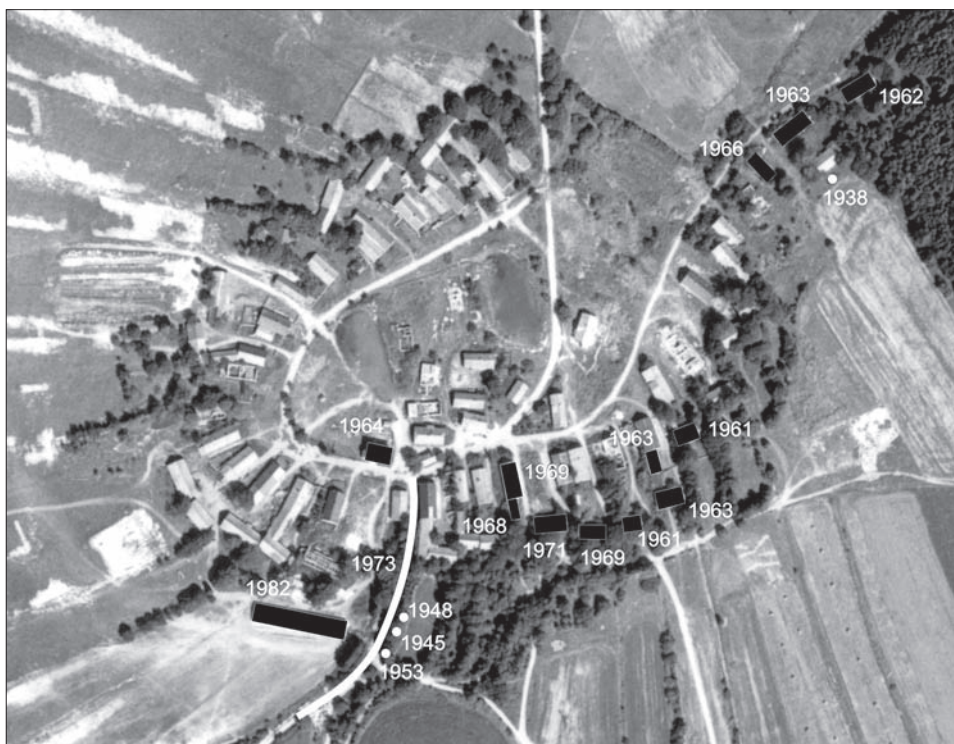
Obr. 4. Zaniklá vesnice Bažantov. Schéma objektů datovaných pomocí dendrochronologie živých stromů. Letecký snímek Vojenský geografický a hydrometeorologický úřad Dobruška, 1955. Schéma L. Funk, M. Váňa.

Posledním z analyzovaných reliktních v této lokalitě je objekt bývalého státního kravína, o kterém víme pouze tolik, že byl vystavěn po roce 1955 a svou dobou užívání přežil fyzický i administrativní zánik Bažantova. Nejstarší z dřevin vyrůstající ze zbytků jeho konstrukce je buk z roku 1982 (obr. 4, tab. I).