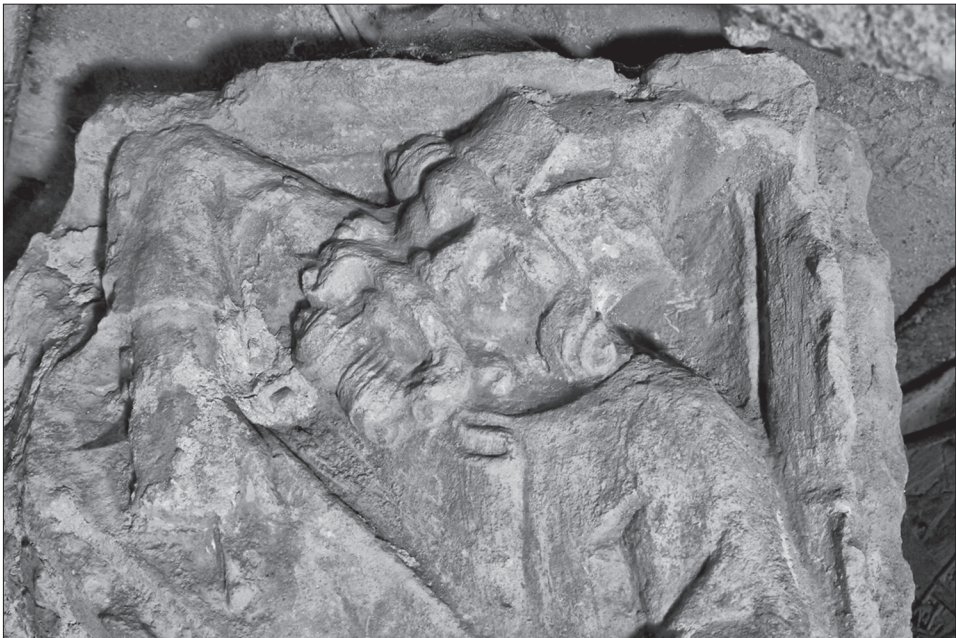
Obr. 4. Trnava, reliéf s vyobrazením proroka, detail. Abb. 4. Trnava, Relief mit Darstellung eines Propheten, Detail.

Žigmundove stavebné aktivity v Bratislave patria k prebádanejším úsekom dejín stredovekého umenia. Predpokladá sa, že časť kamenárov prišla do Bratislavy z Budí-