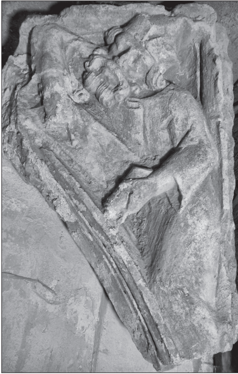
Obr. 3. Trnava, reliéf s vyobrazením proroka. Abb. 3. Trnava, Relief mit Darstellung eines Propheten.

podmieneny autenticky doloženými pamiatkami. Predpokladá sa však, že do okruhu kamenárskej produkcie z rezidenčného kráľovského hradu môžu patriť aj iné diela, ktoré kvalitatívne rozširujú túto skupinu – napríklad tzv. hlava kráľa (dnes v zbierkach Galérie mesta Bratislavy), blízka krásnemu slohu a jeho rakúskym príkladom (Glatz 1999, 24–25, so staršou literatúrou). Spojenie tejto plastiky s Bratislavou však nie je prijímané jednoznačne (Bartlová 2004, 89).