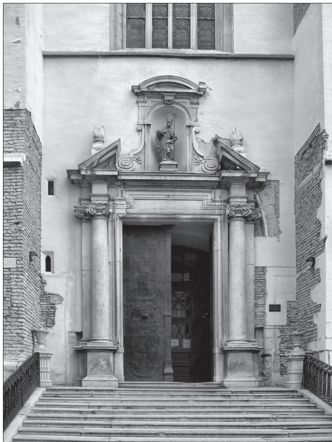
Obr. 8. Trnava, Kostol sv. Mikuláša, západný portál.