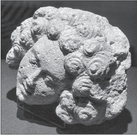
Obr. 7. Bratislava, hrad, busta, azda hlava anjela. Abb. 7. Bratislava, Burg, Büste, vermutlich der Kopf eines Engels.

náhrobkov (Lóvei 1999, 104–105), ktorého práve bádanie identifikovalo na základe charakteristickej štylizácie detailov, vrátane plastických špirálových motívov.