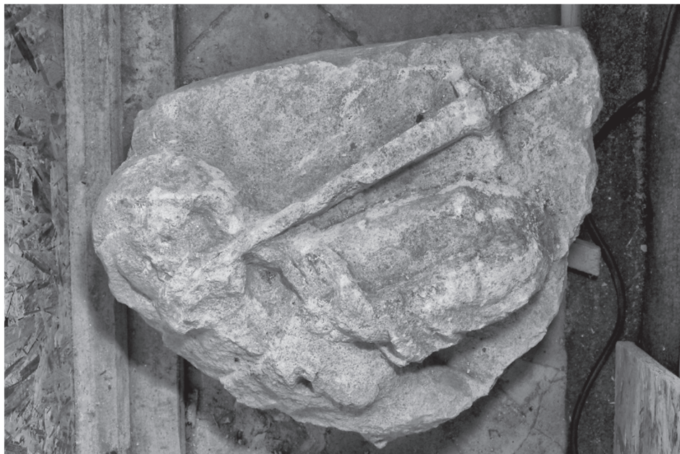
Obr. 5. Trnava, reliéf s figúrou Krista-Sudcu.

Abb. 5. Trnava, Relief mit Christus als Richter.