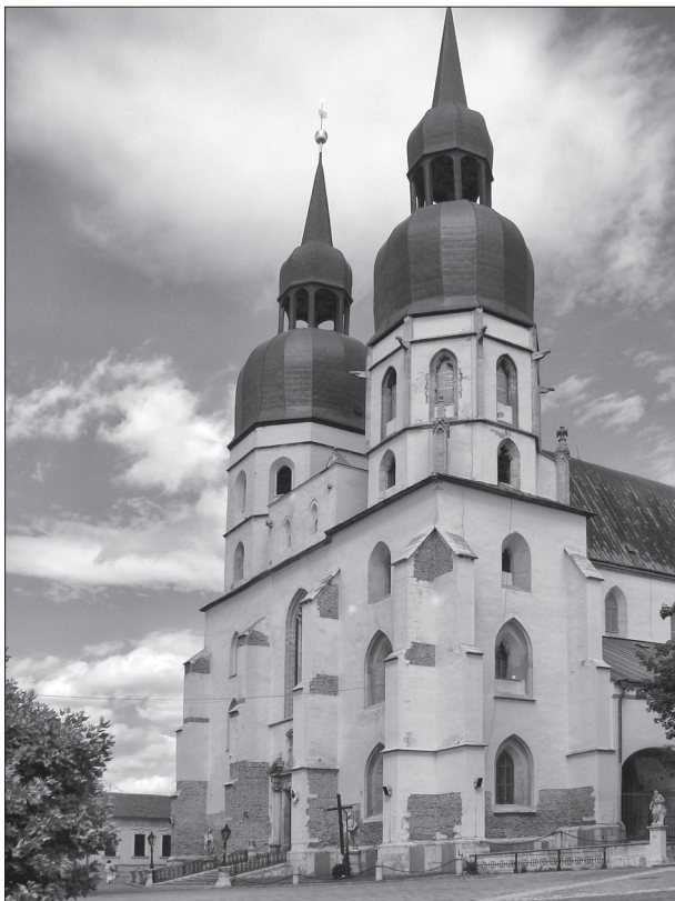
Obr. 1. Trnava, farský Kostol sv. Mikuláša.