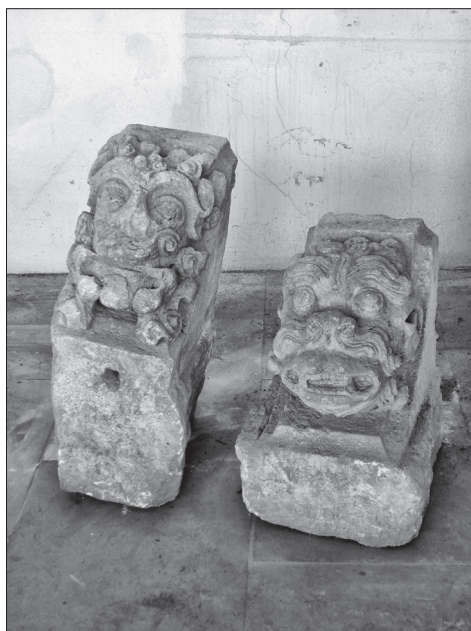
Obr. 6. Bratislava, hrad, konzoly s maskarónmi.