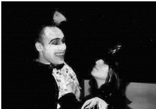
Obr. 3. Apollinaire, Prsy Tiresiovy