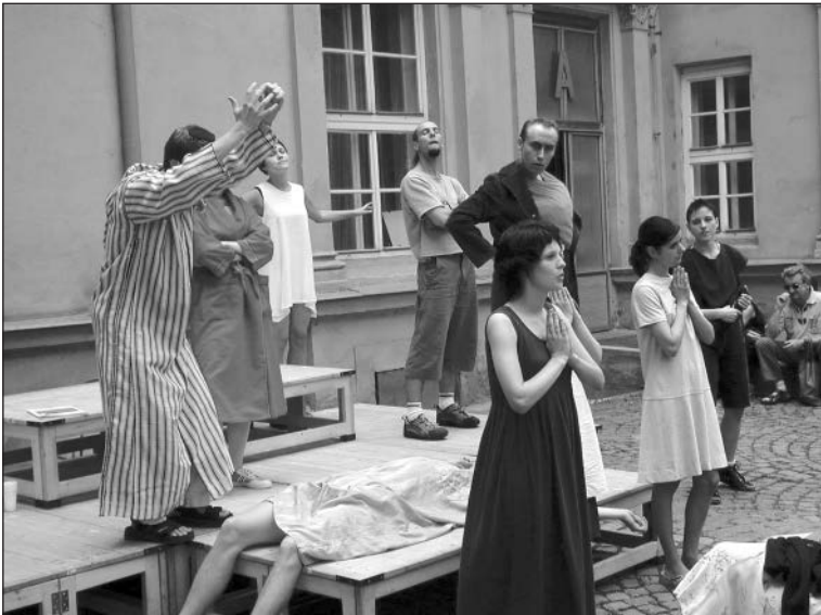
Obr. 5. Mastičkář