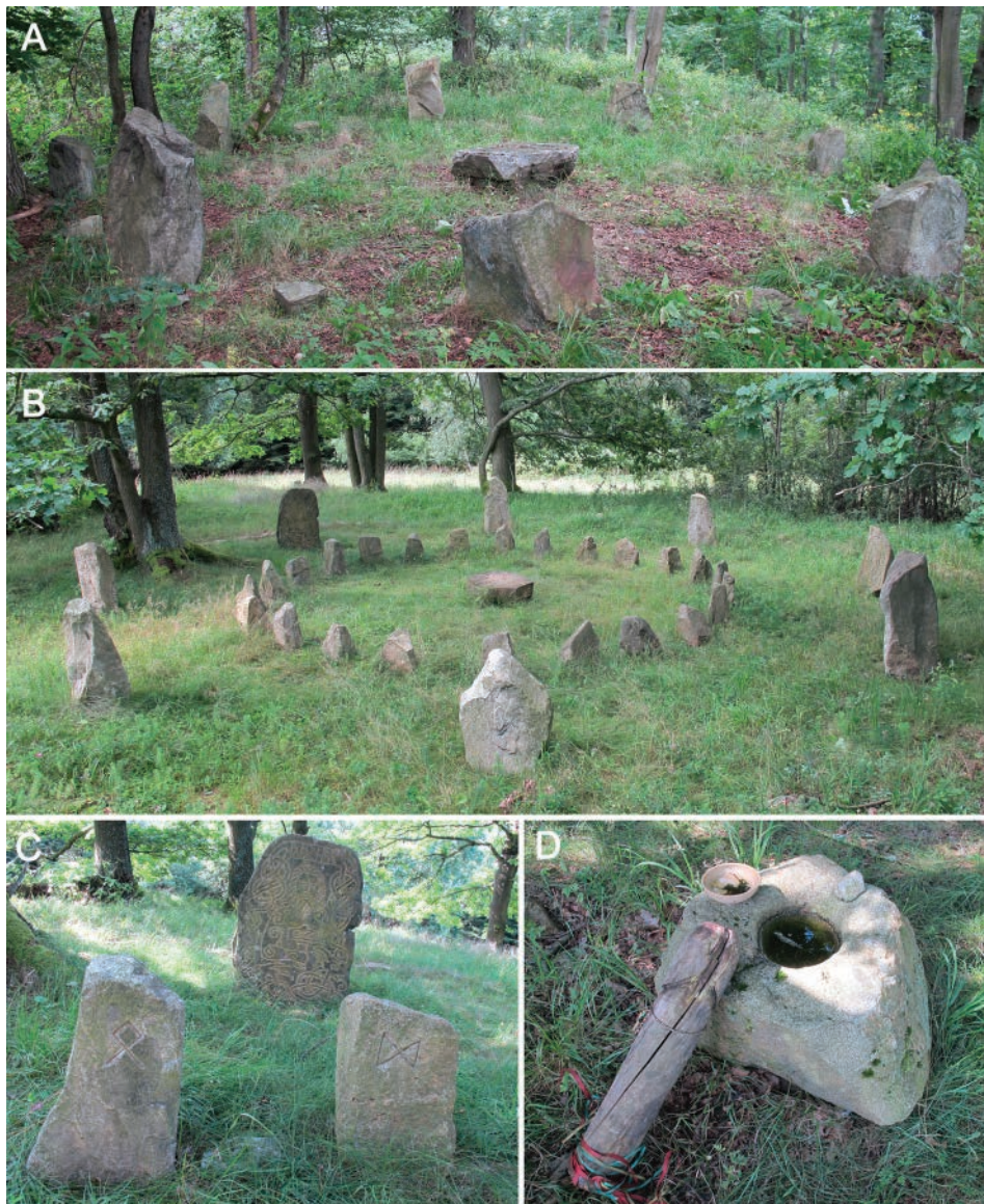
Obr. 2. A – kromlech u Spolí; B – celkový pohled na runový kruh u Štětkře; C – pohled na runové kameny vnitřního kruhu a importovaný kámen s rytinami v pozadí; D – obětní místo v blízkosti kromlechu u Štětkře.

Kamenný kruh o průměru cca 6 m vznikl v areálu výšinné lokality ze starší doby železné na katastru obce Spolí ( Hrubý – Valkony 1999 ). Skládá se ze středověkého oltáře a osmi velkých vztyčených kamenů (až 1 m nad povrchem), mezi nimiž je