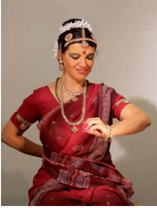
2/ वाहन vūz, kočár