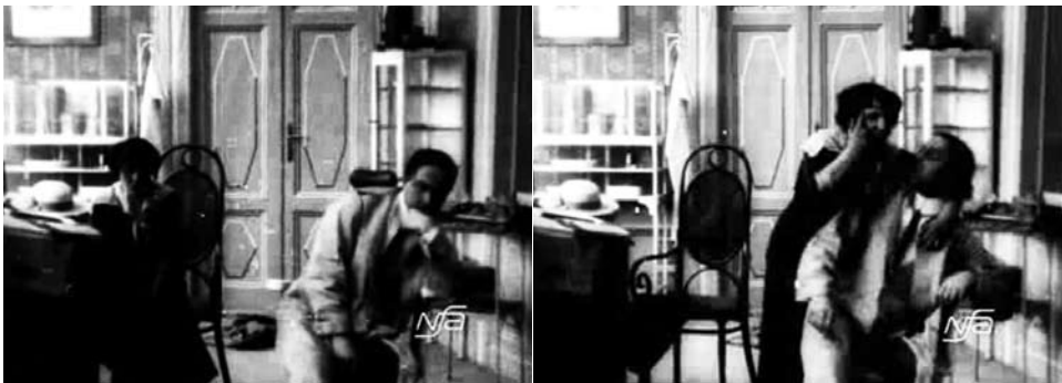
Obr. 10. Zub za zub.