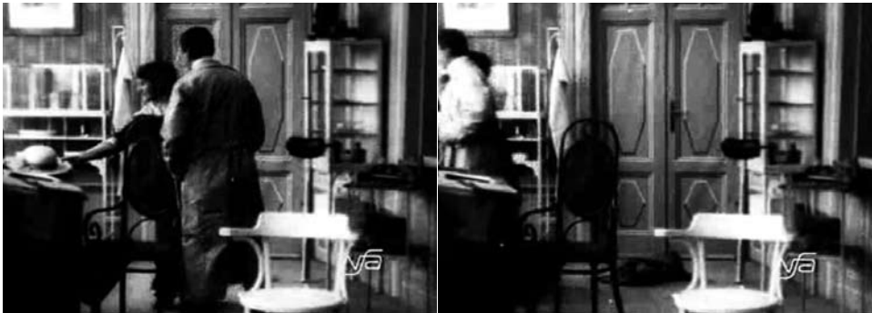
Obr. 11. Zub za zub.