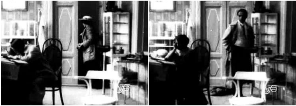
Obr. 9. Zub za zub.