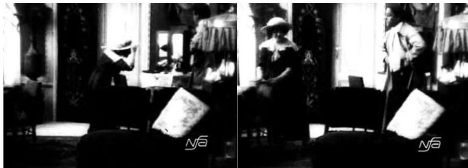
Obr. 12. Zub za zub.