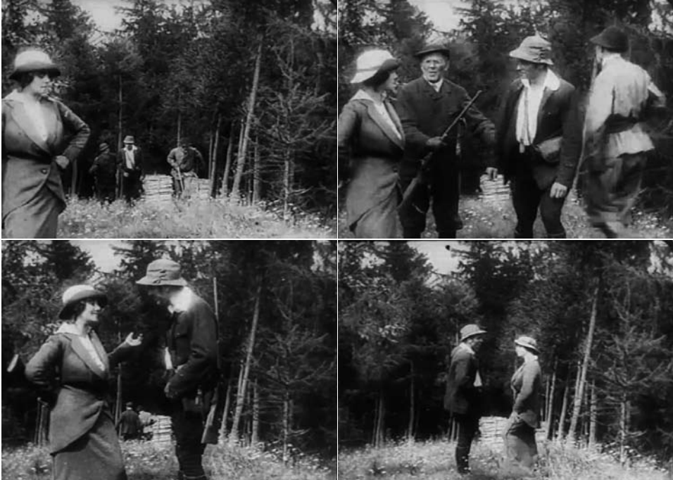
Obr. 1. Konec milování.

s přáteli (obr. 1). Ti se po chvílce konverzace od dvojice oddělí, díky čemuž jsou zřejmější sílící sympatie mezi hlavními postavami. Během družného rozhovoru se postupně vzdalují od kamery, přičemž jejich soulad je ještě akcentován jejich postupným přesouváním se do vyvážené kompozice v centru rámu.