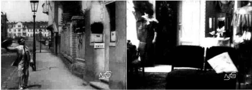
Obr. 15. Zub za zub.

cem“. 9 Pantomimicky se s ním na něčem domlouvá, pan Bílý jí políbí ruku a ona vejde do domu, zatímco on netrpělivě stále v tomtéž záběru přechází před domem. V určitou chvíli se zadívá nahoru do oken, smekne, přikývne a potěšeně vchází do domu. Následuje záběr na Milenu u okna, kde očividně dávala panu Bílému znamení (obr. 15): jde o jediné dva záběry ve filmu spojené návazností pohledu – střih ve směru pohledu pana Bílého ustaví prostorovou vazbu mezi ulicí před domem a obývacím pokojem Chudobových.