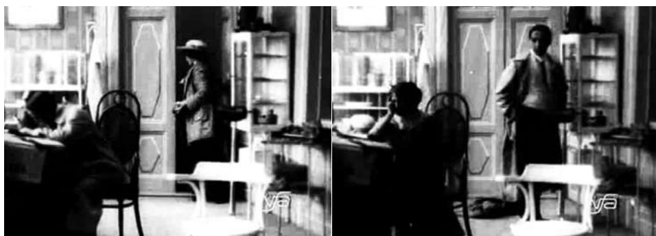
Obr. 9. Zub za zub.