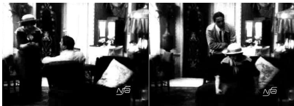
Obr. 13. Zub za zub.