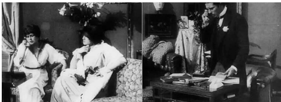
Obr. 3. Křížový střih: telefonní hovor.