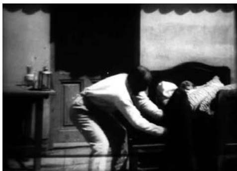
Obr. 6. Pro peníze .

Navzdory jednoduchému (a prostorově vysoce eliptickému) návaznému střihu je třeba Rudi na záletech inscenován striktně v tableau kompozicích, což ještě více platí pro prostorově zcela nenávazného Rudiho sportsmanem . Promyšlenější práci s tableau postupy vidíme však ve snímku Pro peníze , jenž pracoval s vyprávěním časově značně „výpustkovitého“ příběhu. Je přitom snímán právě v dlouhých časoprostorově uzavřených nenávazných záběrech s občas překvapivě prostorově hloubkovými inscenačními volbami (střet předních a zadních plánů). Pokojové interiéry byly natáčeny venku před domy, což sice zřejmě působilo a rovněž dnes působí značně nevěrohodně. Mělo to ovšem překvapivě pozitivní důsledky pro práci s tableau postupy a přehlédnutelností herecké akce (bylo na ni dobře vidět). Za prvé byla rovnoměrně osvětlena celá scéna, čímž byla vyřešena potřeba umělého osvětlování akce. To bylo (nejen) u nás v té době standardní, jak ostatně píše v souvislosti se zeměmi s malou filmovou produkcí Bordwell s Thompsonovou: „Mnoho interiérových scén bylo natáčeno na otevřených scénách za slunečního svitu.“ (THOMPSONOVÁ a BORDWELL 2011: 86) Na druhou stranu toto rozhodnutí zajišťovalo bližší pozici kamery vzhledem k postavám, než bylo v daném období běžné, protože rám nesměl zabírat střechu, aby se udržovala iluze uzavřené místnosti.