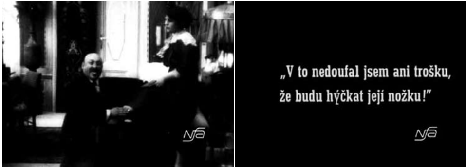
Obr. 17. Zub za zub.