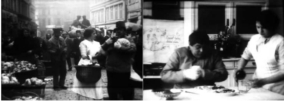
Obr. 7 / 8: Pět smyslů člověka.

samotné téma rozsáhlého poetologického propojení kabaretní a filmové kultury v českých zemích ještě čeká na zpracování. Možný vliv kabaretu vidím ve třech aspektech tvorby Kinofy, které se v komediálních dílech objevovaly společně a v nekomediálních zejména třetí z nich: (a) struktura skeče, v níž je důraz na silnou pointu, která nemusí nutně vyplývat z logického plynutí dosavadních událostí, (b) performativní herectví: obrácení se na diváka, narušování iluze uzavřeného časoprostoru, (c) mediální performativnost: technické možnosti filmu, sebeuvědomělé funkce mezititulků.