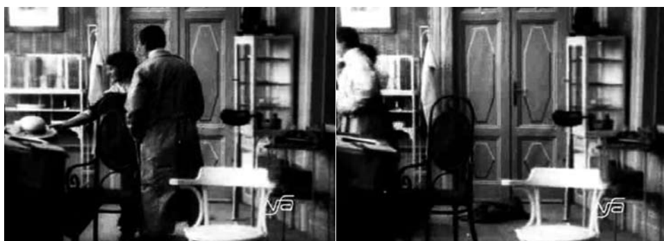
Obr. 11. Zub za zub.