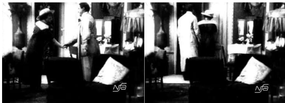
Obr. 14. Zub za zub.