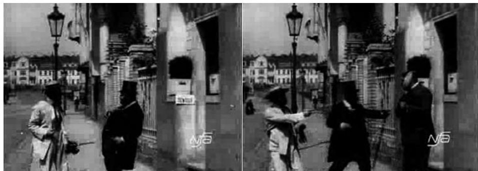
Obr. 16. Zub za zub.

Ozvláštňením narativního vzorce pak prochází i dvojice scén s napálením jednotlivých nápadníků: pana Bílého Chudoba nutí dojít do ordinace pouze gesticky, zatímco u pana Tučného je situace doplněna o neustálé Chudobovo vyhrožování Tučnému střelnou zbraní. Ačkoli je tedy narativní organizace cyklická, filmaři se snažili posílit komický efekt nad rámec prostého opakování stejné situace.