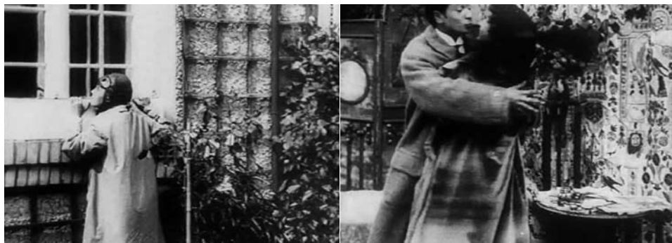
Obr. 4. Návaznost pohledu: snoubenka vidí přes okno svého milého v náručí sokyně.