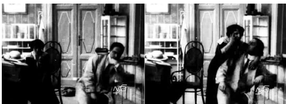
Obr. 10. Zub za zub.