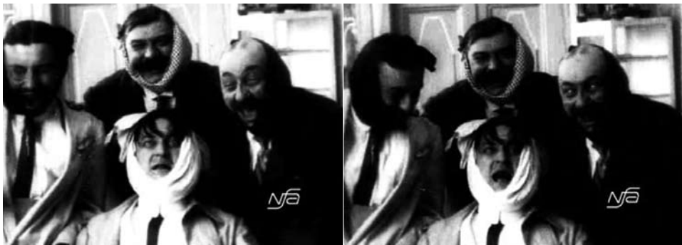
Obr. 18. Zub za zub.