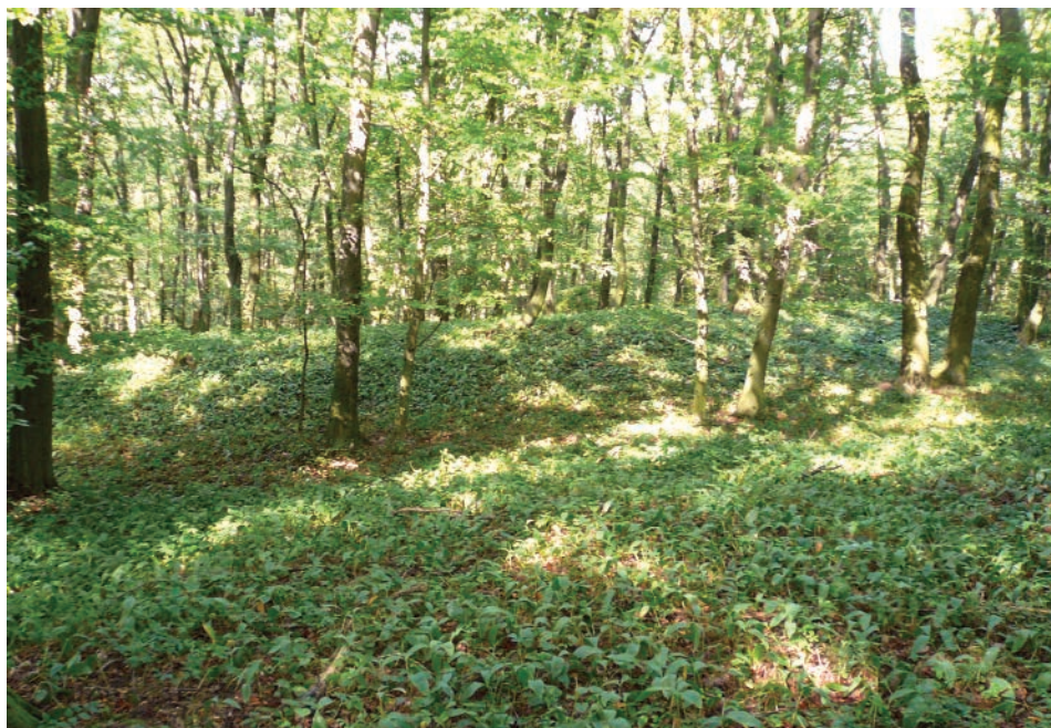
Obr. 4. Borkovany, okr. Břeclav. Čelo východní opevněné lokality při katastrální hranici Velkých Hostěrádek, pohled od jihozápadu.

plizlý, a tak je jasně viditelné jen projmutí příkopu na jižní straně. Ten je 12 m široký a pouze 0,7 m hluboký. Využitelná, téměř kruhová plocha hradiska má osy 46 a 41 m. Také jeho čelo proti stoupajícímu svahu chrání po obvodě oblouk valu, který je v koruně 3 m široký a oproti niveletě obytného areálu 2,3 m vysoký (obr. 4). Okružní příkop lze jen tušit v místě cesty na západě a v nepatrném zvlnění na protější straně.