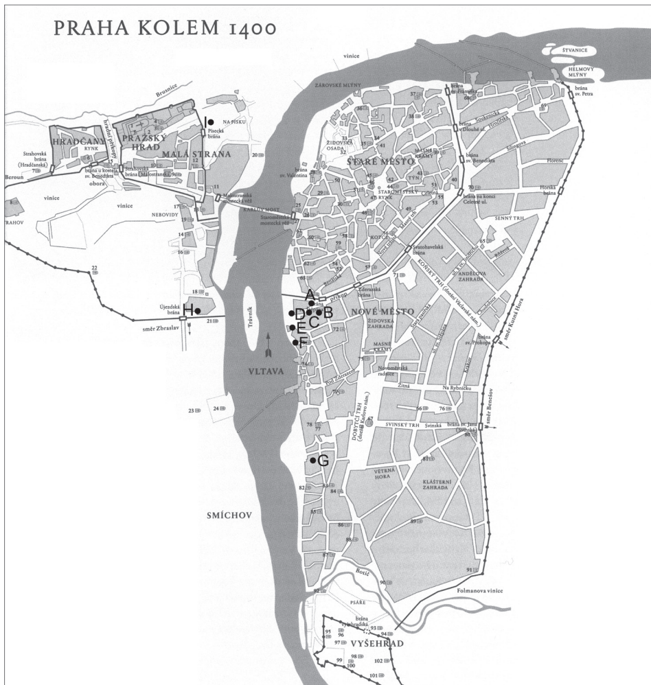
Obr. 1. Vápenky a cihelny v pozdně středověké Praze. Podklad mapy podle Karel IV. 2006, 199.