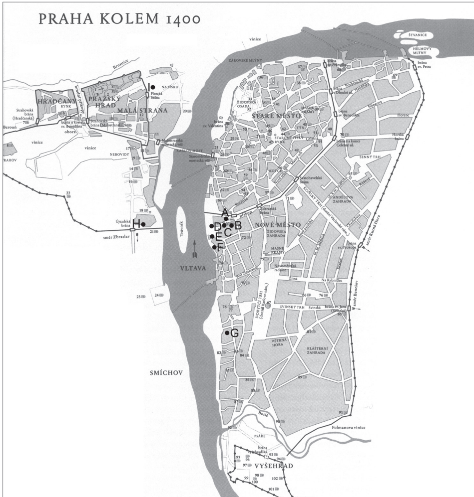
Obr. 1. Vápenky a cihelny v pozdně středověké Praze. Podklad mapy podle Karel IV. 2006, 199.