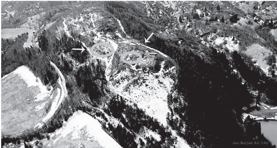
Obr. 1. Pôdorys Glanzenbergu s opisovanými objektmi. 2 – cesta, 3 – val, 4 – plošina nad dobývkami, 5 – poloha Kostolík, 6 – fortifikačné veže, cisterna a hradná kaplnka. Abb. 1. Grundriss des Glanzenbergs mit Objektbeschreibung. 2 – Weg, 3 – Wall, 4 – Fläche über den Abbaustätten, 5 – Lage Kostolík, 6 – Festungsturm, Zisterne und Burgkapelle.

rakterizovať majiteľa objektu. Medzi ne patrí polovica kamenného mlyna na drvenie rudy, sklo, technická keramika, troska a najmä olovené počítacie žetóny, ktoré pravdepodobne súviseli s registráciou množstva odovzdanej rudy na jej testovanie (Hunka 2009, 18). Možno konštatovať, že obidve miesta nálezu strieborných obolov predstavovali v 14. storočí veľmi dôležité a najmä