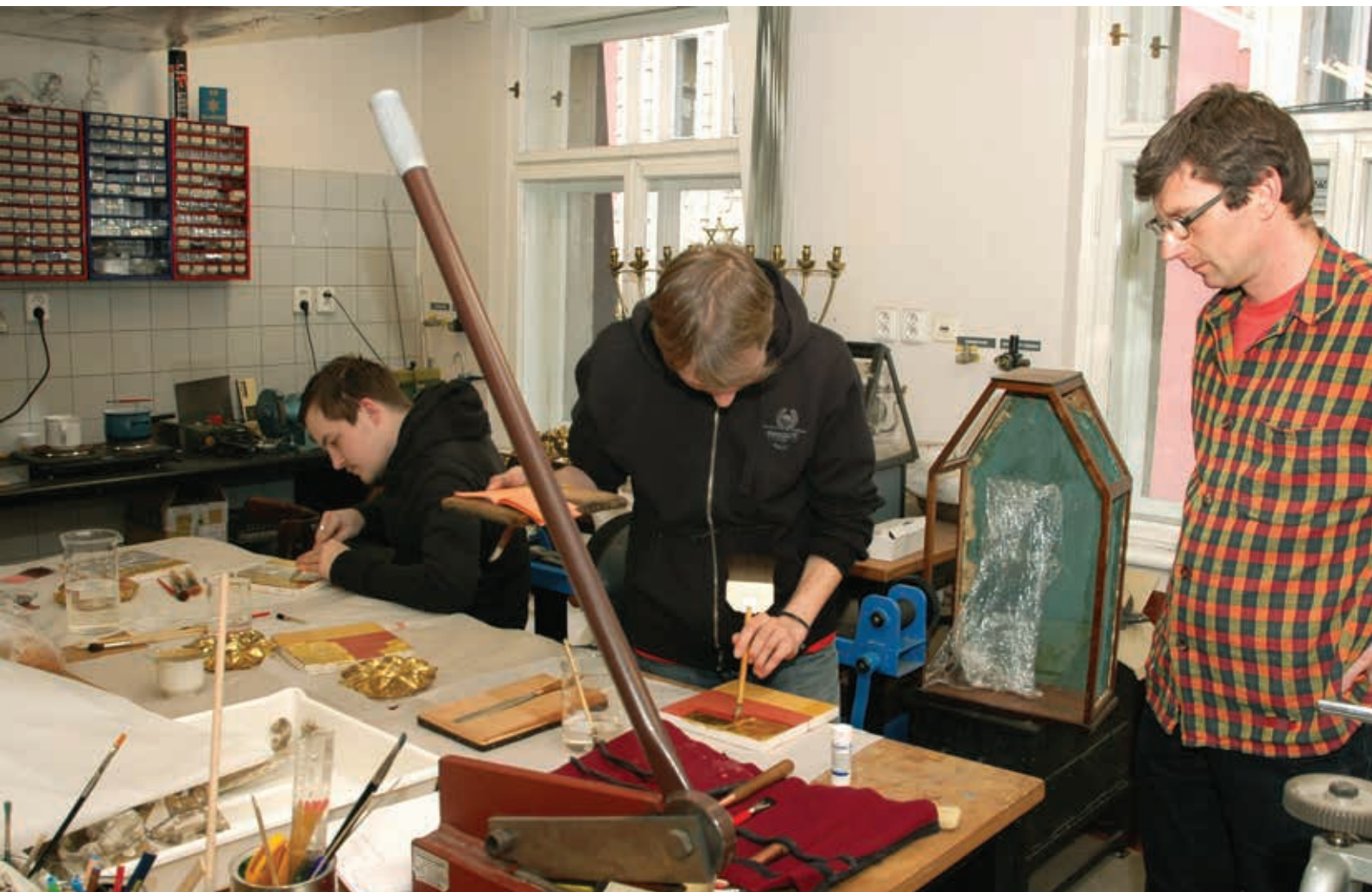
Leštění a pokládání zlata pod dohledem lektora

v projektu zastoupených (restaurátoři, konzervátoři, fotografové) předpokládal rozvoj dovedností na trhu práce zcela unikátních nebo špatně dostupných (např. restaurování fotografie, mikroskopování, pozlacování, fotografování v nepříznivých podmínkách, ovládnání programů pro digitalizaci kulturního dědictví atd.). Poté, co jsme absolvovali všechna školení organizovaná Magistrátem hl. města Prahy a viděli, jaký je o podporu z OPPA zájem, jsme si moc nevěřili, vždyť do naší prioritní osy a podprogramu se nakonec v rámci čtvrté výzvy přihlásilo 244 projektů. Postupně jsme se však prokousali všemi hodnotícími koly a skončili na 34. místě (podpořeno bylo celkem 42 projektů). I když byly námi žádané prostředky mírně sníženy, nakonec jsme získali pro projekt podporu ve výši 1 158 766 Kč.