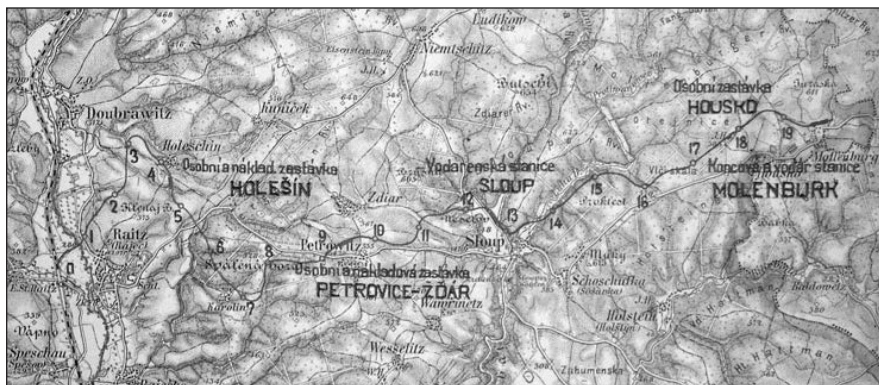
Vyznačení trasy lokální dráhy do mapy – výřez, r. 1914

Stavba lokálky z Rájce do Molenburka se objevila v době, kdy existovalo či se rodilo několik obdobných projektů, jež měly dnešní blanenský, tehdy boskovický okres doslova prošpikovat železnicemi. Cílem bylo využít hlavního tahu z Brna přes Českou Třebovou na Prahu a napojit blízké lokality na tuto trať, případně vytvořit spojnice s dalšími tratěmi, jako kupř. Brno- Přerov, či Prostějov-Třebovice – tzv. Moravskou západní dráhou, na kterou navazovala též místní dráha Chornice-Velké Opatovice, zprovozněná r. 1889. S Moravskou západní dráhou byla trať Brno-Česká Třebová v tomto regionu propojena r. 1908 protažením lokálky z Velkých Opatovic přes Boskovice do Skalice n. Svit. 3 Při projektování lokálky z Rájce do Molenburka bylo však již počítáno s tím, že se v budoucnu protáhne z Molenburka směrem na Drahany a přes Plumlov až do Prostějova a odtud do Přerova, přičemž z výchozí stanice v Rájci nad Svitavou se opačným směrem vybuduje železniční tah přes Černou Horu na Tišnov, což vše mělo v konečné fázi tvořit „transversální dráhu“ (tj. příčnou dráhu), kterou si sami pro sebe můžeme nazvat Prostějov-Rájec-Tišnov“. 4 Jak vidno, jednalo se o záměry nemalého rozsahu. V téže době pak vznikaly další dva neméně zajímavé projekty – jednak to byla o něco dříve (v l. 1899–1905) projektovaná trať z Blanska do Vyškova, vedoucí přes Lažánky, Jedovni-