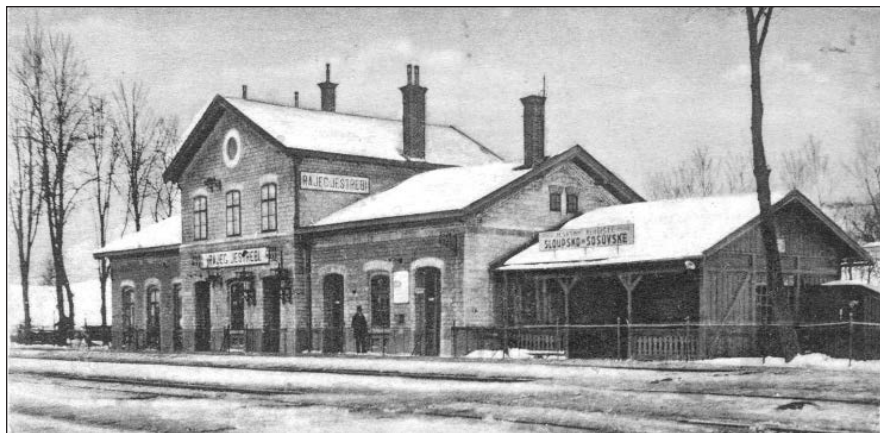
Výpravní budova v Rájci-Jestřebí na ojedinělém zinném snímku z let 1926–1931. Střed budovy měl dle projektu být výchozím bodem zamýšlené lokální dráhy.