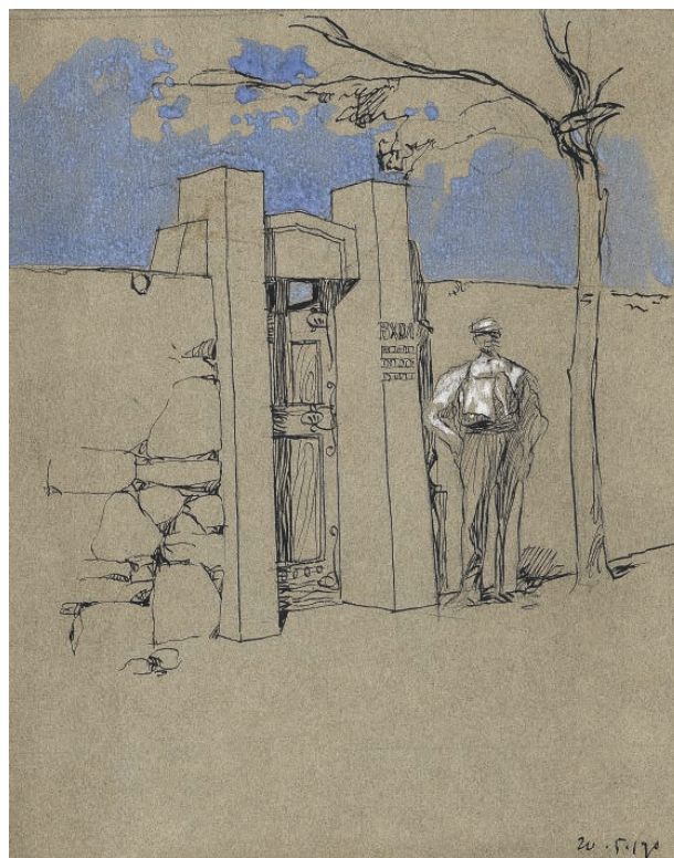
3 – Jan Kotěra, návrh postranních vstupních vrátek do areálu Barbo Christo na Krymu, 1902.