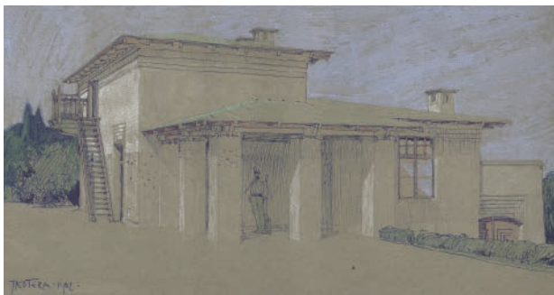
2 – Jan Kotěra, návrh tzv. provizorního domu v areálu Barbo Christo na Krymu, 1902. Archiv Národního muzea, fond K. Kramář, inv. č. 2880