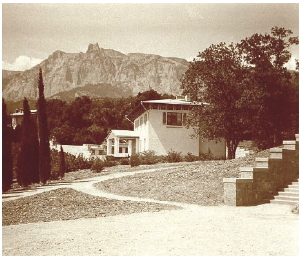
5 – Tzv. provizorní dům v areálu Barbo Christo na Krymu, nedat.

Od moderní architektury – k architektuře. Moderní architekturu považoval za splnění úkolu účelu, konstrukce a poezie, což ve svém článku O novém umění do velké míry pojmenovával i Jan Kotěra. Pavel Janák však poskytl novou perspektivu, která požadovala nejen splnění požadavku účelnosti, ale jeho přesažení. Takový ideál nacházel v empírové a neoklasicistní architektuře: „V celé dosavadní historii nebyla architektura nikdy tak omezeně vázána na účel a účel byl pro ni vždy nabídnuvší se příležitostí člověku – umělci vyjádřiti svou myšlenku stavbou a jejími prostředky; toto vyjádření se bylo v architektuře začasť až tak převážným podílem tvoření, že deformovalo až i sám účel (poslední krásné příklady k tomu chápeme dnes o mnoho hlouběji v empiru, jemuž architektonický ideál, jím osobitě aplikované antiky, byl tak život formulující, že stavěl si své antikizující představy a myšlenky i tehdy, kdy šlo o zcela – dle našeho názoru – světské účely). [...] Mnoho z těch děl moderní architektury, jež svou kvalitou představují vrchoły dosavadní architektury, přechází o mnoho dále za mez splnění účelu a má právě tam svou cenu.“ 45