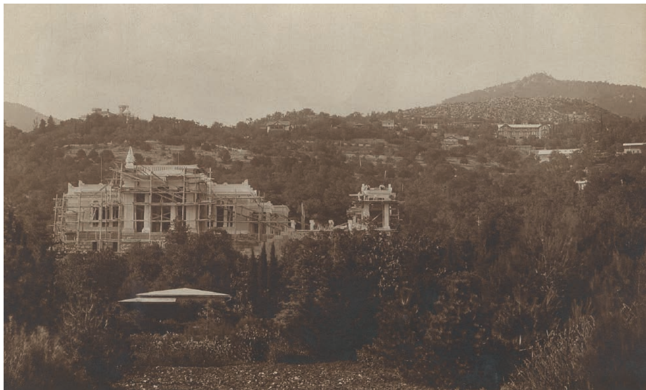
4 – Fotografie rozestavěné vily Barbo, v popředí zahradní domek, asi 1905. Archiv Národního muzea, fond K. Kramář, inv. č. 3053

V roce 1910 se Pavel Janák vyjádřil velice jasně k wagnerovskému požadavku účelnosti architektonické tvorby v textu