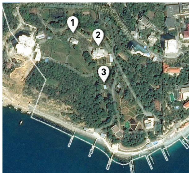
1 – Situace areálu vily Karla a Naděždy Kramářových. [1] Provizorní dům vystavěný podle projektu Jana Kotěry z roku 1902; [2] Vila, vystavěná na základě dispozice Jana Kotěry po roce 1904, [3] zahradní domek

Do nedávna byl známý pouze poněkud příkrý dopis Jana Kotěry Naděždě Kramářové z 9. ledna 1903, v němž vy-