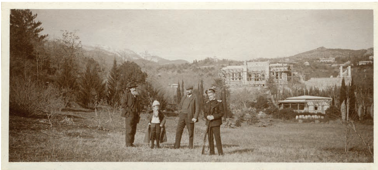
7 – Rozestavěná vila Barbo, před ní zahradní domek, zcela vpravo je patrná část tzv. provizorního domku.