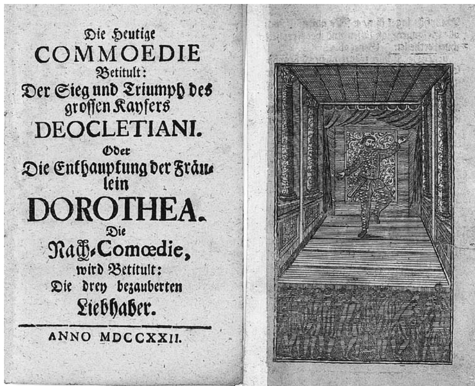
Abb. 12: Nürnberger Szenar zu Die Enthauptung der Fräulein DOROTHEA (Stadtbibliothek Nürnberg, Sign. Will. VIII.574)

Dorotheenstück statt Morio seine Späße, doch nicht mehr in Doppel-Conference mit dem Sklaven, der wieder auf seine ursprüngliche Aufgabe als Notzuchtverweigerer reduziert wird.