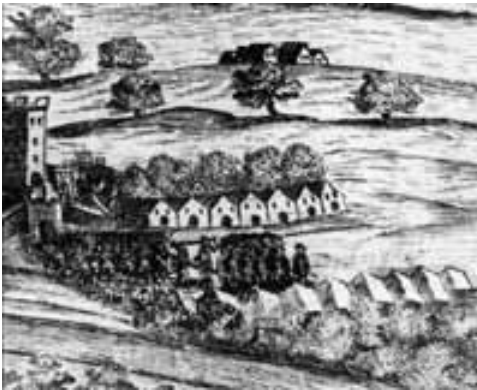
Obr. 3. Vjezd knížete Karla Eusebia z Lichtenštejna do Opavy v roce 1632. Detail dřevorezu s pohledem na Jaktářské předměstí. Fotoarchiv SZM. Abb. 3. Einzug von Fürst Karl Eusebius von Lichtenstein in Troppau im Jahr 1632. Detail eines Holzschnittes mit Blick auf die Vorstadt Jaktar. Fotoarchiv des Schlesischen Landesmuseums.