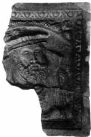
Obr. 14. Lüneburg-Altstadt 29. Zlomek kadlubu se saským kurfiřtem Janem Vilémem. Podle Ring 2007a, Abb. 7b.

Abb. 14. Lüneburg-Altstadt 29. Fragment eines Modells mit sächsischem Kurfürst Johann Wilhelm. Nach Ring 2007a, Abb. 7b.