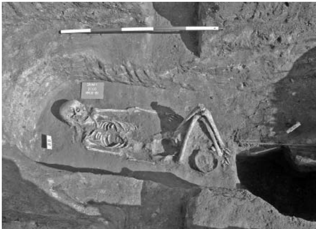
Obr. 4. Hrob 89 a objekt 93. Dolní končetiny pohřbené ženy jsou pokrčeny a respektují hranici objektu 93, ve kterém byla nalezena kompletní kostra kozy nebo ovce. Foto T. Mořkovský.

Abb. 3. Grab 92. Eines der zwei Nischengräber vom Typ unterhalb des Damms, die 2005 freigelegt wurden. Foto T. Mořkovský.