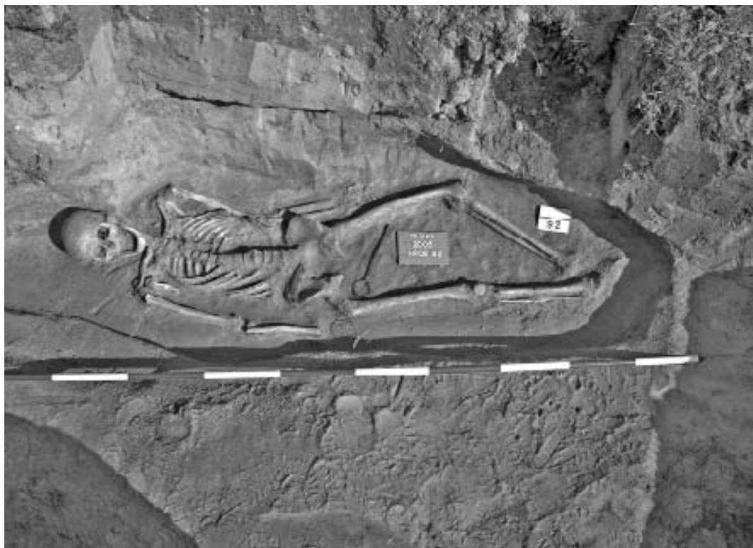
Obr. 3. Hrob 92. Jeden ze dvou výklenkových hrobů podmolového typu odkrytých v roce 2005. Foto T. Mořkovský.

Abb. 3. Grab 92. Eines der zwei Nischengräber vom Typ unterhalb des Damms, die 2005 freigelegt wurden. Foto T. Mořkovský.