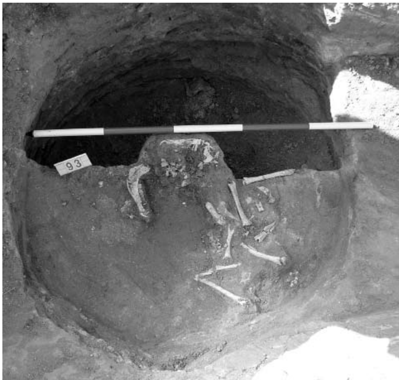
Obr. 5. Objekt 93 se skeletem ovce či kozy související s hrobem 89.